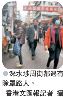
●深水埗周街都遇有除罩路人。

然而就在這樣令人堪憂的衛生環境下，居民完全缺乏防範意識，除罩煲煙、聚集飲酒是深水埗的常態，有人甚至坐在骯髒的水渠旁吞雲吐霧，殊不知病毒與他近在咫尺。此外，深水埗長者較多，許多長者不具備衛生防範意識，有除罩在人群中穿梭的，也有除罩坐在街市旁午睡的，更有一家幾口連同孩子在路上邊走邊吃。