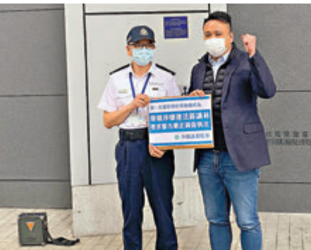
●「沙田議會監察」舉報逾30名區議員涉嫌違法。

香港文匯報訊(記者 子京)逾50名參與「35+初選」分子涉嫌違反香港國安法中的「顛覆國家政權」罪，早前被警方國安處拘捕。昨日，「沙田議會監察」兩名代表到警察總部請願，舉報超過30名曾積極參與「35+