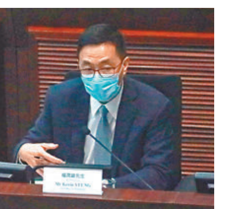
●楊潤雄表示，目標是盡快於9月推行新的通識科課程。

香港文匯報訊(記者 郭虹宇)「黃師」藉通識教材荼毒學生的情況屢見不鮮，昨日立法會教育事務委員會召開第一次會議，多名議員關注教材及師資的監管問題。教育局局長楊潤雄表示，局方希望盡快於9月落實新的通識課程，而國家安全涵蓋多個範疇，將會滲透在不同科目以加強通識科教育；局方最快於第一季完成制訂詳細指引，以及分享過去處理教師投訴個案的經驗。 在會議上，多名立法會議員對文憑試通識科維持必修必考感到失望。其中民建聯立法會議員周浩鼎認為，過去的黑暴事件反映通識科荼毒學生情況非常嚴重，通識科改革需求急切，應該取消或轉為選修。 立法會教育事務委員會主席梁美芬亦認為，現時部分教師的質素令人擔心，建議通識教師都要經過考試才可教授新的通識科，不應將現時任教通識的教師，直接轉型教授改革後的通識課程，怕會「換湯不換藥」。 楊潤雄回應時表示，若有教師違反專業操守，局方必定認真處理，希望在本年首