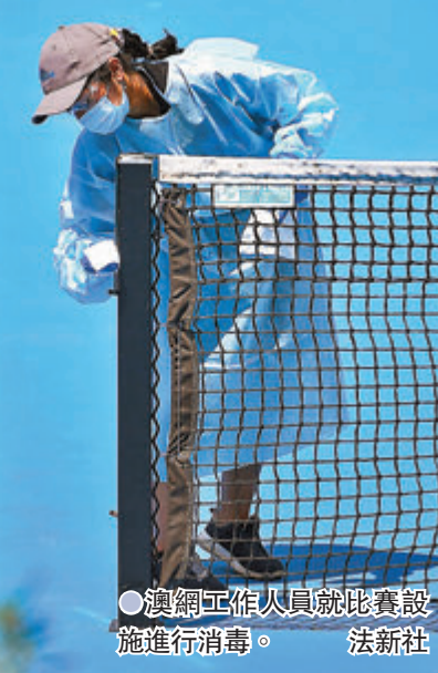
●澳網工作人員就比賽設施進行消毒。

澳洲衛生官員表示，目前在墨爾本隔離的球手及支援人員中，還有9人尚未康復。目前大部分選手一天獲准出門訓練5小時，惟有72人因為入境包機出現新冠陽性案例，因此被禁止踏出房門。