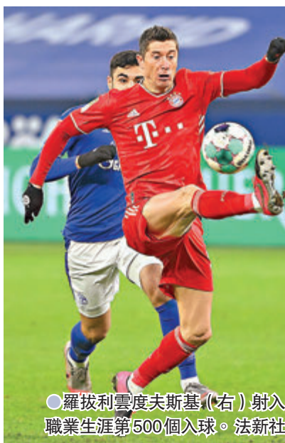
●羅拔利雲度夫斯基(右)射入職業生涯第500個入球。

另一方面，德甲拜仁慕尼黑周日作客以4球淨勝史浩克04，其中羅拔利雲度夫斯基雖只射入1球，但這入球是他職業生涯第500個入球，在現役球員中只有美斯、C朗拿度和伊巴謙莫域能達成此成就。此外利雲度夫斯基亦成為首位能夠於連續8場德甲客場比賽皆有入球的球員。