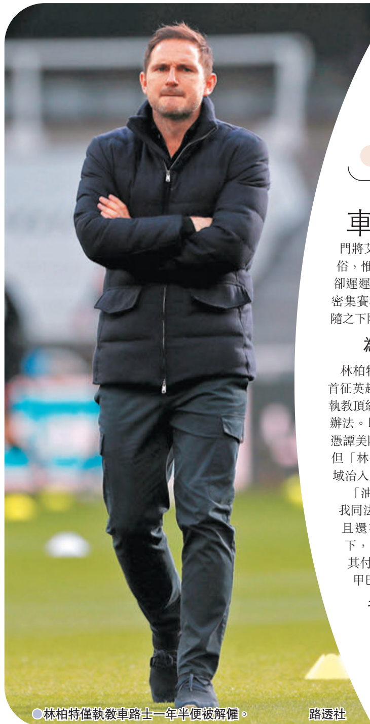
●林伯特僅執教車路士一年半便被解僱。