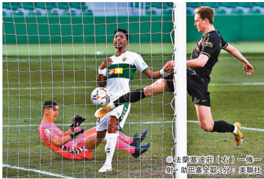
●法蘭基迪莊(右)一傳一射，助巴塞全取3分。

香港文匯報訊(記者 楊浩然) 西甲於西班牙時間周日上演多場比賽，其中榜首的馬德里體育會主場以3:1反勝華倫西亞，繼續維持榜首優勢。至於巴塞隆納雖作客以兩球淨勝艾爾切，並留守在聯賽榜第3位，但球隊近日卻被指陷入債務危機，負債高達6億歐元，據報球隊已提出推遲償還債務的要求，以避免被迫宣布破產。