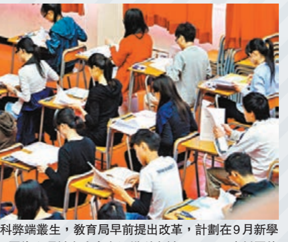
通識科弊端叢生，教育局早前提出改革，計劃在9月新學年落實。圖為文憑試考生參與通識科考試。資料圖片