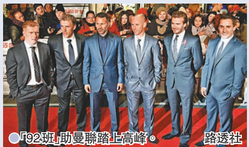
●「92班」助曼聯踏上高峰。

香港文匯報訊(記者楊浩然)如果你問一位曼聯球迷他對球隊最自豪的地方是什麼，相信很多曼迷均會表示對球隊以青訓為本，