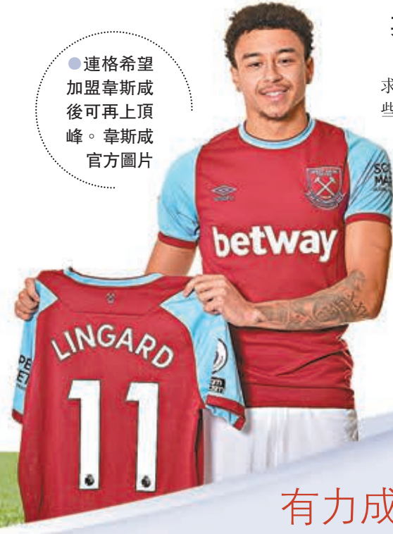
●連格希望加盟韋斯咸後可再上頂峰。

英格蘭向來以足球發源地自居，為求增加奪取世界盃的籌碼，往往對一些剛冒起的英格蘭年輕球員大加吹捧，奈何此舉卻不時迎來反效果，突如其來的名利令這些初出茅廬的小將陷入迷霧，韋舒亞、禾確特以至連格均是活生生的例子，如何協助後起之秀走在正途之上，將是整個英格蘭球壇需要反思的課題。