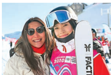
●谷愛凌(右)成為首位在U型場地比賽奪冠的中國選手。資料圖片

另外，國際奧委會於當地時間29日在官方網站公布，17%的北京冬奧會參賽名額已名花有主。據《人民日報》報道，北京冬奧會其中11個項目的資格賽已重啟。