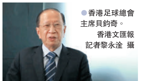
●香港足球總會主席貝鈞奇。

他又補充：「足球是一門職業，不能視作一般運動，其他行業例如飲食業，接觸人流更多，卻仍可營業，大型商場更是人頭湧湧。足球只是在空曠地方進行，球會每周也會作病毒檢測，理論上應該要盡快開放。」