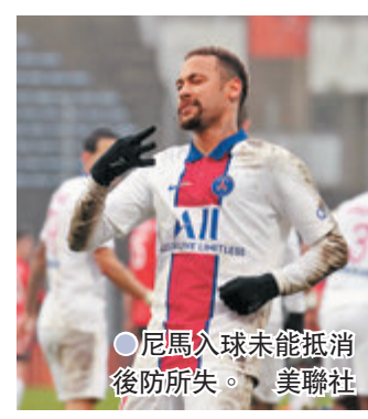
●尼馬入球未能抵消後防所失。

香港文匯報訊(記者 楊浩然)法甲班霸巴黎聖日耳門(PSG)在當地時間周日作客竟以2:3不敵羅連安特，新教練普捷夫吃下上任後首場敗仗。值得慶幸的是，主力尼馬接受訪問時親口否認今夏轉投皇家馬德里的傳聞，更直言除了自己，亦希望隊友基利安麥巴比可一同留在PSG。