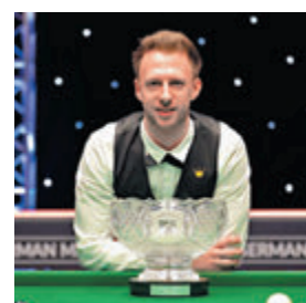
●卓林普再添桂冠。

香港文匯報訊(記者 陳曉莉)桌球德國大師賽於香港時間昨日凌晨落幕。世界排名第1的卓林普繼續保持強勢，以9:2輕取利索夫斯基，成功衛冕，在收穫8萬英鎊冠軍獎金的同時，還贏得職業生涯第21個冠軍。中國「一哥」丁俊暉也率多位師弟參賽，但丁在8強以3:5被卓林普淘汰。