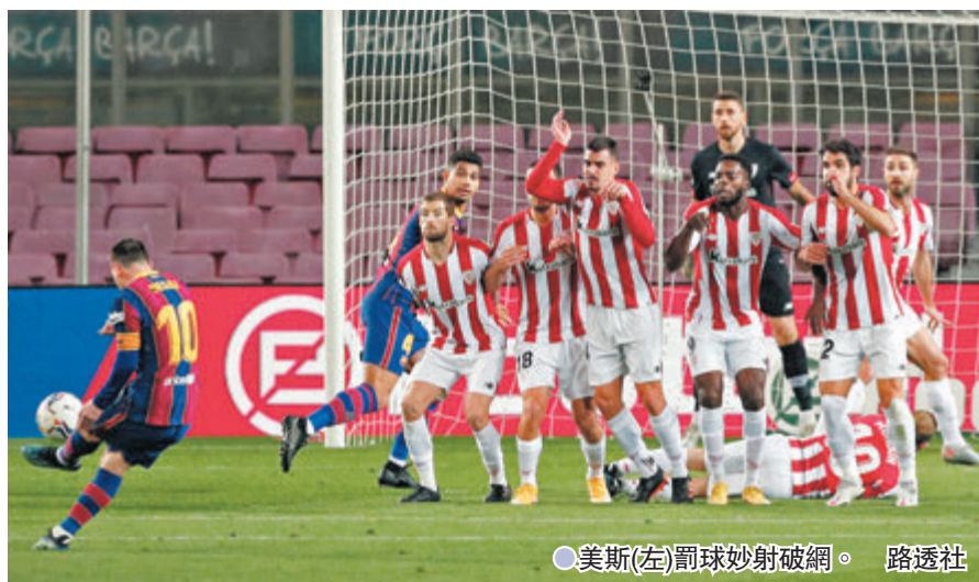
●美斯(左)罰球妙射破網。