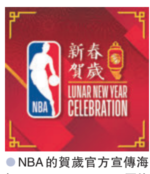
●NBA的賀歲官方宣傳海報。

香港文匯報訊(記者 陳曉莉) NBA於香港時間昨日宣布，NBA新春賀歲活動將於本月7至27日舉行，這是NBA連續10年以中國佳節為主題舉辦的慶祝節目，主要內容包括精彩比賽直播、全新的NBA春節宣傳影片，以及一系列NBA主題活動。