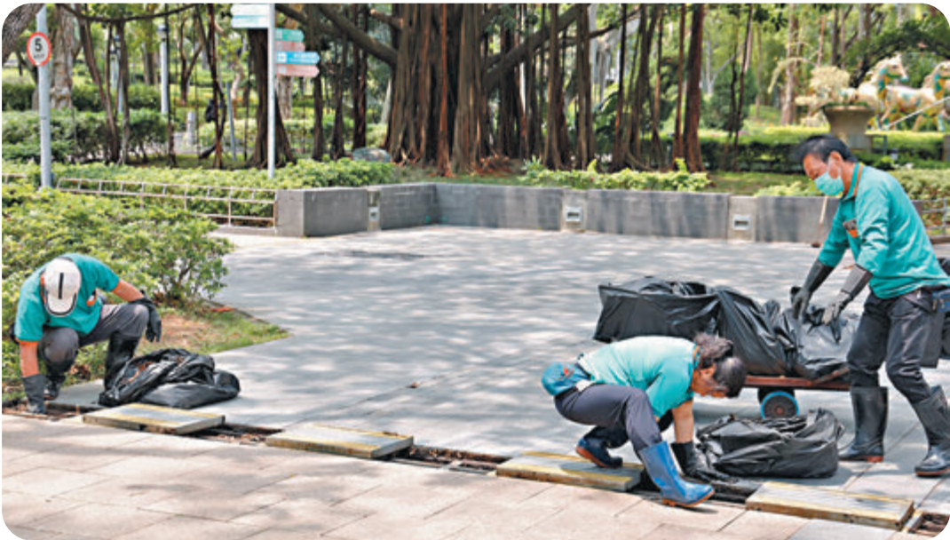
● 行政長官會同行政會議接納最低工資委員會的建議，維持現行法定最低工資水平在每小時37.5元，是最低工資制度自2011年實施以來首次「凍薪」。圖為清潔工人在清理垃圾。 資料圖片

羅致光昨午會見傳媒交代《最低工資委員會2020年報告》，報告指大多數委員的共識是維持法定最低工資水平在每小時37.5元，委員會下次完成檢討最低工資是明年10月31日或之前，約2.1萬名僅領取最低工資水平的打工仔，未來兩年無望加薪。