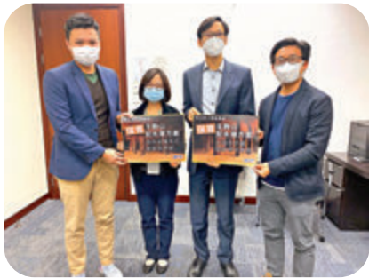
● 民建聯要求當局加快保育主教山百年古蹟。

香港文匯報訊（記者 鄭治祖、文森）深水埗主教山配水庫羅馬式建築曝光後，引起社會廣泛關注。深水埗區議會地區設施委員會昨日舉行會議，首度討論相關保育事宜，水務署代表在會上指，未來3個月會進行臨時加固工程，強調會與古蹟辦溝通，盡量保持古蹟完整性。會前民建聯深水埗團隊向官員遞交信件，要求當局盡快對配水庫古羅馬建築群作歷史評級，展開保育及活化工作，並在安全情況下開放建築群給市民觀賞，並提供適當的公共休憩空間。