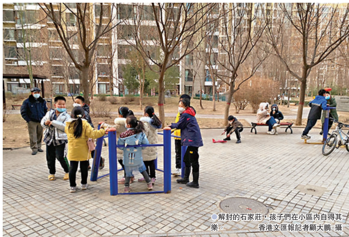
●解封的石家莊，孩子們在小區內自得其樂。

張伯禮表示，河北新增確診病例由最高近百例增長，到現在日增個位數，說明河北疫情整體趨勢見好，防控措施效果顯現。張伯禮還指出，河北疫情和武漢不一樣，武漢病例清零後就徹底沒有了，河北病例即使清零，也會因寒冷季節有利於病毒生存，後續出現散發病例，因此，確診病例只要是個位數就是拐點出現了。他進而指出，疫情發生後河北處置速度很快，效率很高，很快進入緊張有序狀態，河北累積的經驗對農村防控提供經驗。