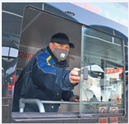
●開「窗」與開「槍」在普通話的讀音不同。 資料圖片

笑話歸笑話，學說普通話的時候還是要認真的，盡量避免在重要的場合出現語言性的問題。學習任何一種語言都需