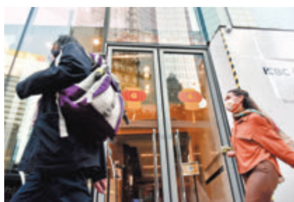
●中環尚至醫療大樓16樓，有一位助理護士確診。