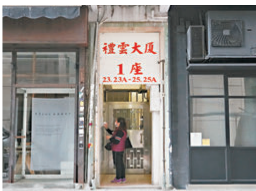
●銅鑼灣禮雲大廈1座亦出現「無源」確診個案，須列入強制檢測名單。中新社