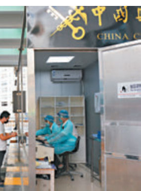
●跨境司機現須於內地通關口岸接受健康申報驗核。資料圖片

另外，立法會航運交通界議員易志明指出，跨境客運業司機一年來都零收入，但仍需要支付日常開支，若政府不額外提供資助維持業界開支，預計農曆新年過後會出現閉關潮，即使恢復營業，但相關交通工具已停駛一年，要更換零件及維修，因此要求政府提供「復