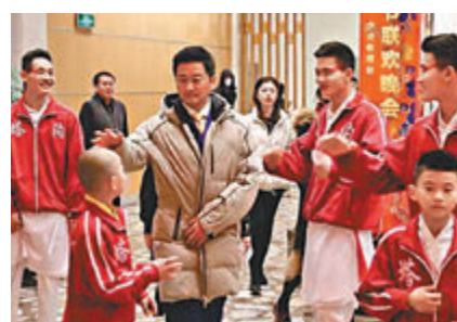
● 吳京對塔溝武校的孩子們疼愛有加。

甄子丹對少林塔溝武校也不陌生。2018年，子丹在電影《大師兄》首映前專程趕到塔溝武校，並與該校師生進行互動，塔溝學員們用人體組成「大師兄」三個字歡迎。子丹非常感動，告訴大家要練好中華武術，為國爭光，並表示要與塔溝武校進行電影拍攝、演出等活動的合作。他還為少林塔溝武校題寫「中華武術，走向世界」並簽名留念。3年後，塔溝武校的功夫小子們如願，與子丹共同站在了央視春晚的舞台上。