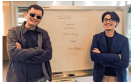
● 王家衛(左)讚導演Baz(右)極有才華。

香港文匯報訊(記者阿祖)王家衛監製、《出貓特攻隊》導演Baz Luowen執導的青春公路電影