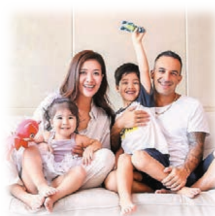
●微博百萬級母嬰博主@神奇的阿茱茱一家四口。