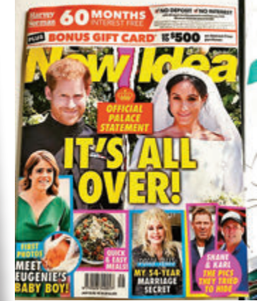
●《New Idea》聲稱哈里夫婦離婚。 網上圖片

消息公布數小時前，澳洲八卦雜誌《New Idea》剛在新一期刊登哈里夫婦「王室官宣離婚」的封面報道，結果隨即被第二胎的消息「打臉」。