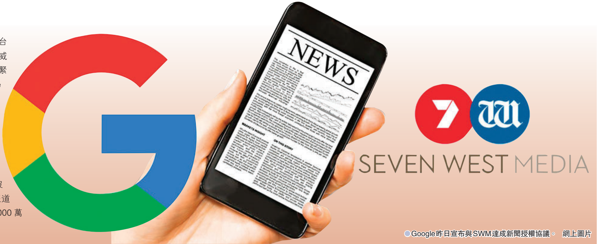
● Google昨日宣布與SWM達成新聞授權協議。

澳洲計劃立法強制科企為平台發布的新聞付費，Google 一度威脅要撤出澳洲，令雙方關係緊張，不過形勢昨日有變。Google 昨日宣布與澳洲傳媒集團 Seven West Media (SWM) 達成新聞授權協議，是首次有澳洲大型傳媒集團同意與 Google 合作，讓旗下新聞報道刊登於 Google 新推出的 News Showcase 平台。雙方沒有透露協議金額，但當地傳媒報道 Google 會向 SWM 支付每年 3,000 萬澳元（約 1.8 億港元）授權費。