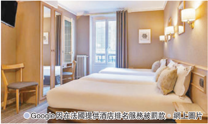
●Google因在法國提供酒店排名服務被罰款。網上圖片