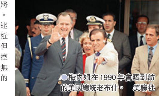
●梅內姆在1990年會晤到訪的美國總統老布什。

梅內姆卸任後多次因貪污及走私軍火等被查，並一度被軟禁，但最終都未曾被定罪。他先後於2003年和2007年再度競選總統，兩次均自行退選，2005年起當選參議員至今。