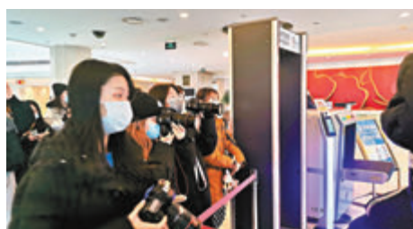
春節前進入梅地亞新聞中心，需要先掃碼填寫「通信大數據行程卡」。

展樣品採集工作，採集樣品類型包括集中空調通風系統衛生狀況、公共用品用具消毒效果、室內空氣質量及生活飲用水衛生狀況，檢測項目涉及微生物指標和理化指標共30項。和東城區一樣，北京多個轄區提前對駐地酒店開展公共衛生監測工作，為駐地酒店場所衛生提供安全保障。