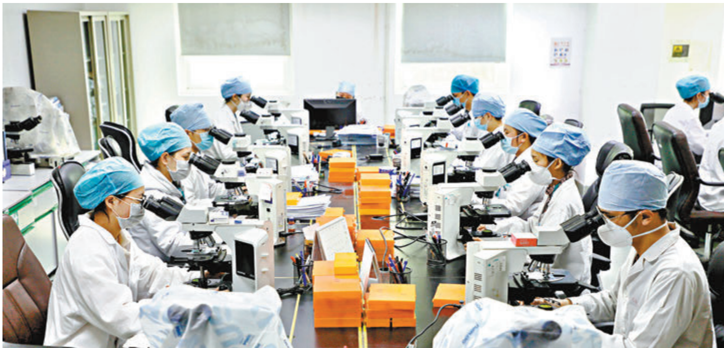
廣州加速布局病毒檢測和疫苗研發生產。圖為達安基因研發團隊。

此外，兩大創新藥項目—安濟盛大分子藥物生產基地、龍騰製藥總部及新藥研發生產基地，也於當天在中新廣州知識城動工建設。前者從事骨質肌肉疾病全球首創新藥研發和生產，後者聚焦腫瘤生態與免疫治療及RNA（核糖核酸，Ribonucleic Acid）醫學研究，並搭建中國乳腺癌專科聯盟。