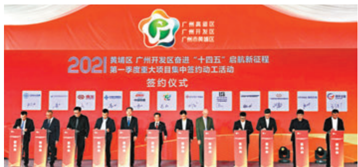
國際疫苗研發和生產創新示範基地簽約動工。