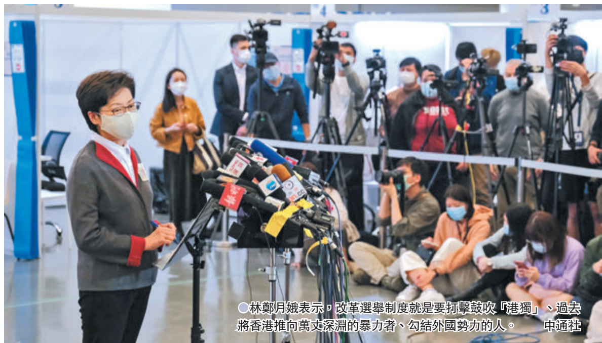
林鄭月娥表示，改革選舉制度就是要打擊鼓吹「港獨」、過去將香港推向萬丈深淵的暴力者、勾結外國勢力的使用

林鄭月娥昨日會見媒體時，對夏寶龍講話作出回應。她表示，首先，「愛國者治港」原則並非新生事物，而是理所當然，是成功貫徹落實「一國兩制」的必然和必要條件。她說，基本法早已明確規定香港是中國不可分離的一部分，以及直轄於中央人民政府，特首亦行雙重負責制，因此在這種憲制秩序和政治體制下要求治港人士愛國是理所當然，不過香港近年發生很多事，所以是時候講清楚這些大原則和大道理，達到正本清源的效果。