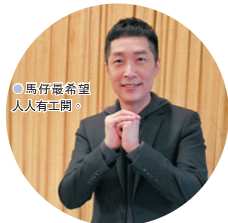
馬浚偉希望人人有工開。