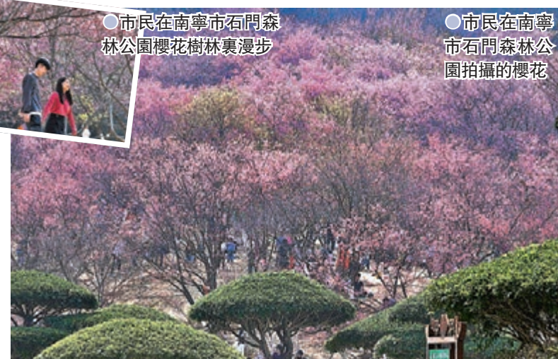
●市民在南寧市石門森林公園櫻花樹林裏漫步