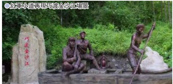
●紅軍小道再現巧渡金沙江場景

走長征路，景區建成了長征重大事件「微縮景觀遊步道（紅軍小道）」，全長2.5公里，像徵着紅軍長征二萬五千里，紅軍小道上再現了長征路上「出發於都河」、「血戰湘江」、「四渡赤水」、「飛奪瀘定橋」、「奠基大西北」等18處重大事件的場景，參與性強，可在徒步旅遊中了解掌握長征歷史，感悟紅軍二萬五千里長征的偉大與艱辛。