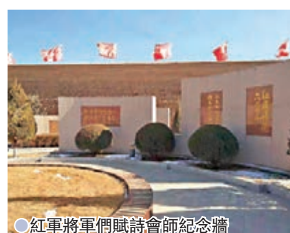
●紅軍將軍們賦詩會師紀念牆