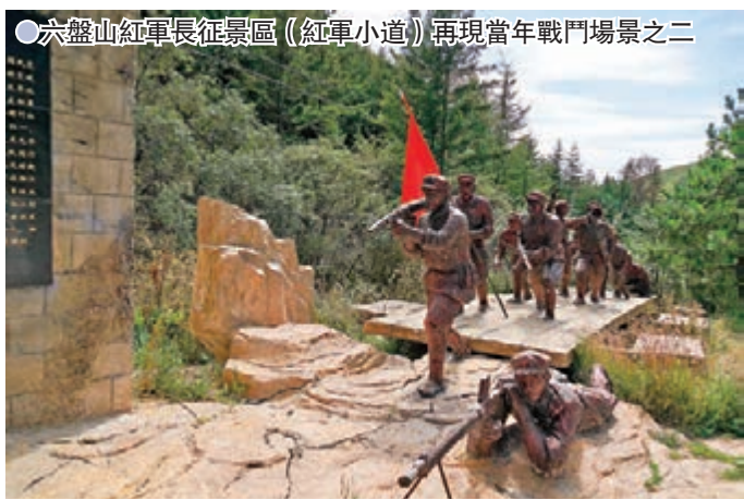
●六盤山紅軍長征景區（紅軍小道）再現當年戰鬥場景之二