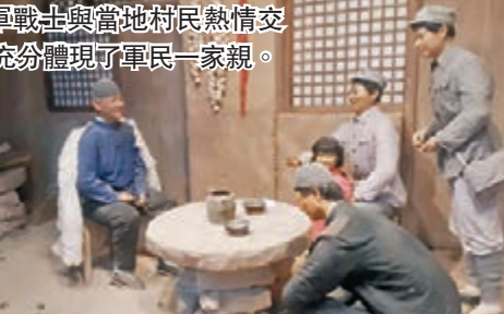
●紅軍戰士與當地村民熱情交流，充分體現了軍民一家親。