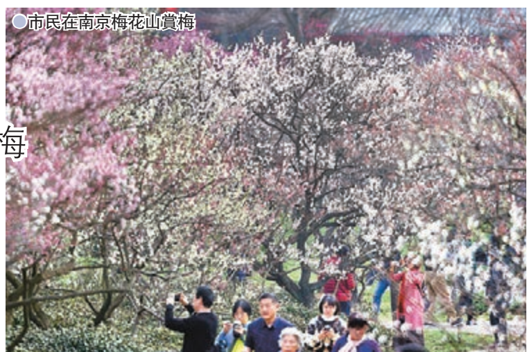
●市民在南京梅花山賞梅

南京梅花山上的梅花「暗香湧動」、「粉紅硃砂」、「多萼硃砂」、「南京早紅」等陸續開放，不少市民在梅花山賞梅。