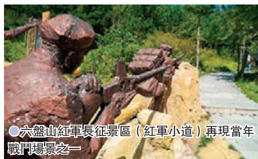
●六盤山紅軍長征景區（紅軍小道）再現當年戰鬥場景之一