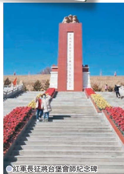
●紅軍長征將台堡會師紀念碑

22日，第二方面軍總指揮部及二軍團到達將台堡，與第一方面軍一軍團、二師（師長楊得志、政委蕭華）在將台堡勝利會師。兩軍首長和會師部隊在將台堡東側的廣場上舉行了盛大的會師聯歡，會師官兵1萬多人，這在紅軍長征史上是一個壯舉。23日，紅二方面軍六軍團（軍團長陳伯均，政委王震）到達將台堡以南15公里處的興隆鎮，與紅一方面軍一軍團一師（師長陳賡、政委楊勇）勝利會師，完成了中國工農紅軍的勝利會師。2016年7月18日，習近平在將台堡向全國發出號召：不忘初心，走好新的長征路。新的長征路從這裏開始！