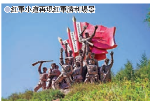
●紅軍小道再現紅軍勝利場景