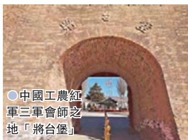
●中國工農紅軍三軍會師之地「將台堡」