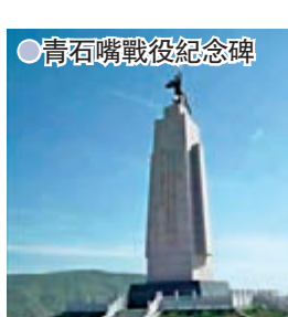
●青石嘴戰役紀念碑

在1935年10月8日早晨，兩路紅軍分別從駐地出發，繼續東進。中午，紅軍相繼到達白楊城