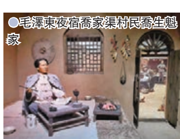
●毛澤東夜宿喬家渠村民喬生魁家

（今彭陽縣城）後，由於形勢緊急，分左右兩路行軍，右路一縱隊經杜家溝，上長城原，夜宿喬家渠、趙家山一帶，毛澤東就住在喬家渠農民喬生魁家。「喬家渠毛澤東長征宿營地」就位於彭陽縣東部長城原之上，距縣城11公里，當年為城陽喬家渠喬生魁家舊莊院，院內有窯洞5孔，最中間的窯洞便是紅軍長征途中毛澤東途經彭陽時的第二處住宿地。2009年，彭陽縣委和政府把鄉村民俗文化和紅色經典相結合，以「喬家渠毛澤東長征宿營地」為主體建設喬家渠民俗風情園，以原生態的農家生活場景為布局，突出窯洞風格，再現紅軍長征的艱苦歲月，勾畫出了一幅美麗的農莊庭院景象。