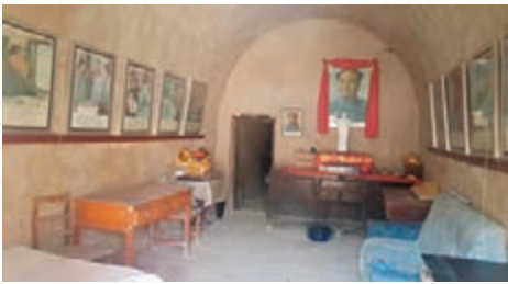
●毛澤東在單家集住過的窯洞