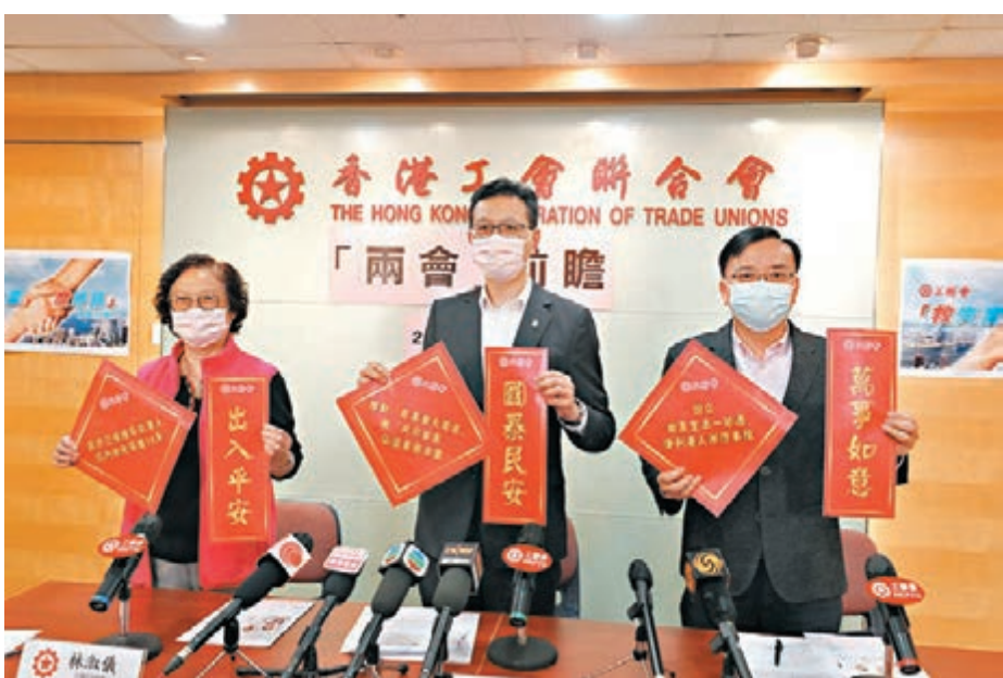
工聯會的港區全國人大代表及全國政協委員將於下周出席在北京舉行的「兩會」，他們昨日在記者會介紹將會提出的建議。