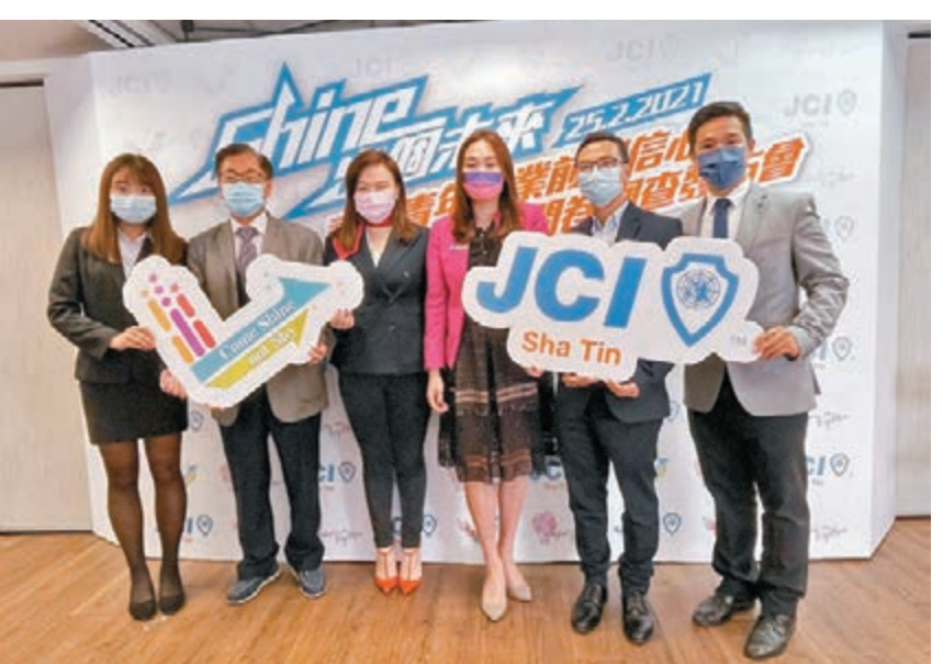
沙田青年商會昨日發布「香港青年就業前景問卷」調查結果，發現於疫情下，近七成受訪年輕人對就業前景持悲觀態度。

香港文匯報訊(記者 邵昕)疫情令市民就業難，有組織調查發現，近七成受訪年輕人對就業前景持悲觀態度，近半數人認為，要超過3個月才能找到工作，23%受訪者有意向至香港以外地點就業，當中逾三分之一選擇到內地發展。組織促請政府為年輕人提供更多資源支持，幫助年輕人提升就業競爭力，並建議年輕人開闊眼界，把握大灣區機遇，謀求更多發展機會。 沙田青年商會於去年12月至今年2月，訪問333位主要來自各大專院校的18歲至27歲年輕人，了解其對就業前景的展望及困擾。調查發現，69%受訪者對就業前景缺乏信心，47%受訪者認為，畢業生起碼要3個月才能找到工作。 同時，有49%及37%受訪者對自己「就業發展方向」及「工作興趣和能力」缺乏了解，46%及35%受訪者則對企業「崗位專業知識」及「招聘流程和程序」缺乏了解。 此外，分別有6%及2%受訪者表示，有意