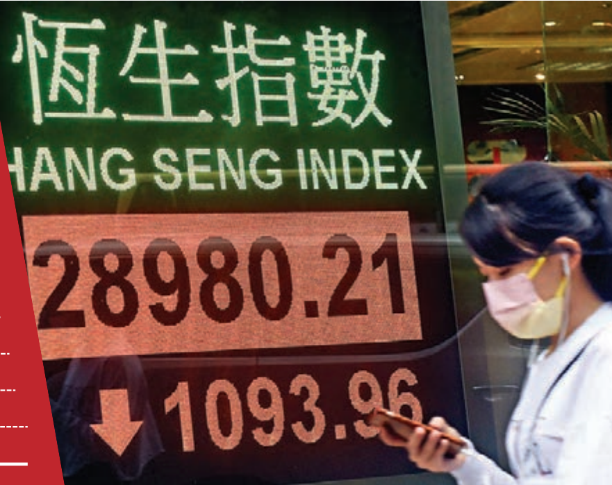
● 港股昨跌穿三萬大關，主板成交3,202億元史上第二高。