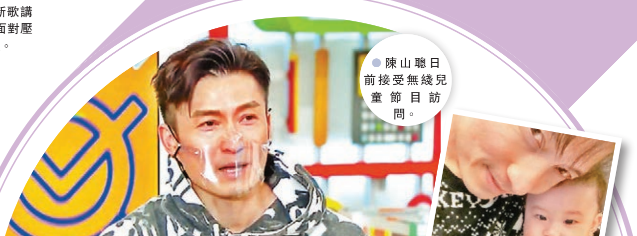
●陳山聰日前接受無綫兒童節目訪問。