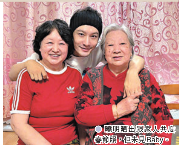
●曉明晒出跟家人共度春節照，但未見Baby。