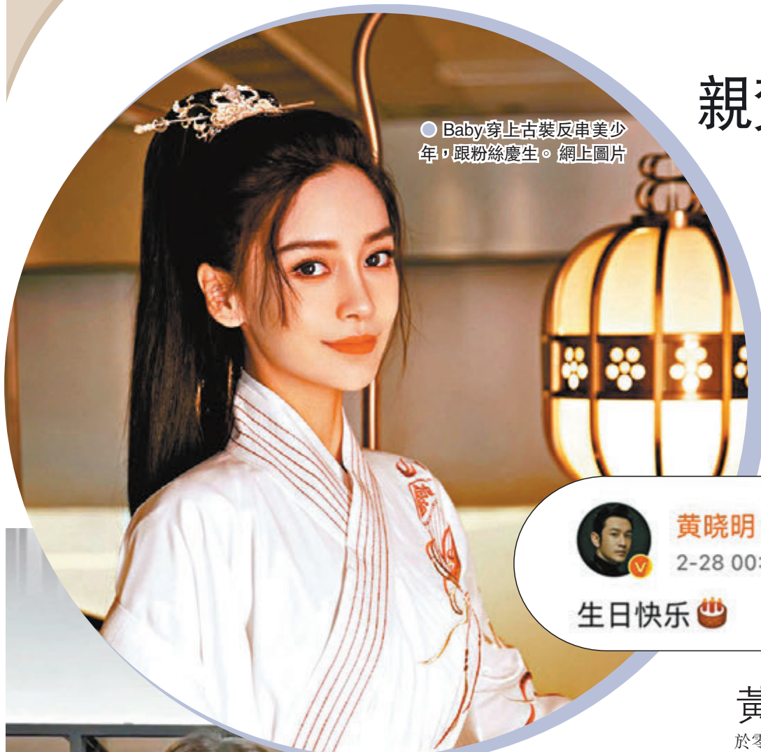
●Baby穿上古裝反串美少年，跟粉絲慶生。網上圖片