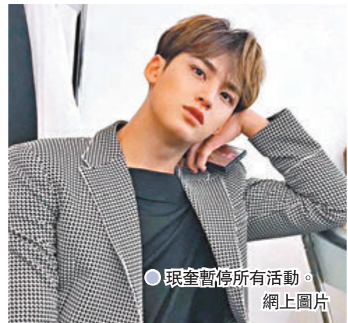
●珉奎暫停所有活動。網上圖片