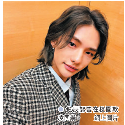
●鉉辰認曾在校園欺凌同學。

SEVENTEEN的珉奎也成為被指控曾霸凌他人的藝人之一，其所屬公司Pledis娛樂昨發出聲明，針對珉奎捲入的校園霸凌疑雲作出澄清，包括日前爆料珉奎在學生時期欺負殘障生的內容，公司表示聯繫受害者，以及聯繫了珉奎的同學，已進一步確認爆料真偽，而結論就是：「完全不是事實」。此外還有接連不斷對珉奎的爆料，公司也說正在查真相，但因為是網絡爆料，本來就很難追溯到背後的人物，或是對方拒絕會面。Pledis方面目前先暫停珉奎所有活動，稱是想先釐清事實，承諾若證實珉奎做錯便會採取適當方式處理。