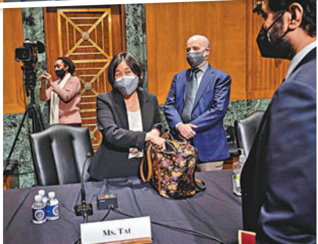
戴琦聲言若磋商未能取得成效，便會「毫不猶豫採取行動」。

戴琦仍有待國會確認提名，年度貿易報告則相當於確認戴琦的貿易政策方針。戴琦前日以書面回覆參議院質詢，提到美國願意透過雙邊會談等多種方式，來處理中國的貿易事務，不過當會談沒有成效時，會毫不猶豫採取行動，但她未有談及行動細節。被問到如何處理對華關稅時，戴琦稱會確保關稅可妥善回應中國行為，亦會考慮對美國