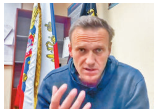
納瓦爾尼被判入獄。

年1月返回莫斯科後，被當局以違反假釋條件拘捕，需服刑約兩年半。拜登上月曾指俄羅斯法院判納瓦爾尼入獄是「出於政治動機」，要求俄方釋放納瓦爾尼。