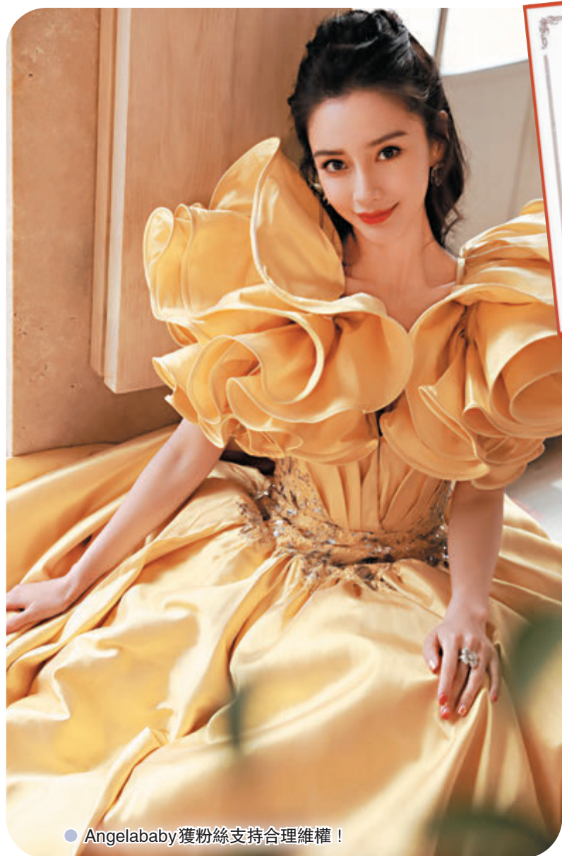
● Angelababy獲粉絲支持合理維權！