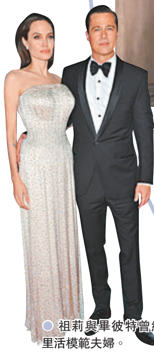
● 祖莉與畢彼特曾經是荷里活模範夫婦。