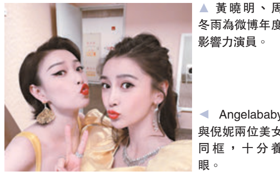
◀ Angelababy與倪妮兩位美女同框，十分養眼。