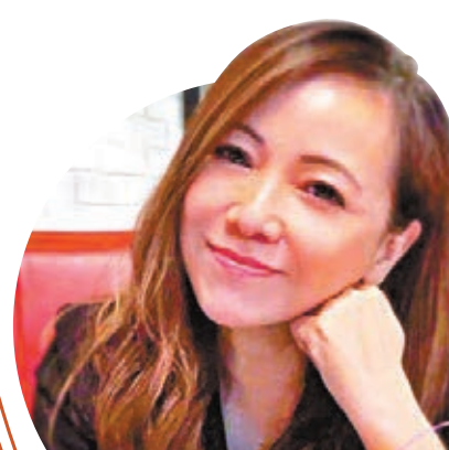
●雯女前日度過55歲生日。

而雯女的功課，就是磨煉人生，因這課程是終身也學習不完，她憑藉宗教信仰去探究人生。她笑說：「小時候測驗讀書常常臨渴掘井，沒想到今天依然故我，慶祝的最高境界就是做功課和自己過，趕功課不是零零後一零後的專利，我加油！」不過即使雯女一個人過生日，但她仍然有收到花和蛋糕，以及身邊朋友和粉絲的祝福！