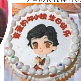
●雯女收到可愛的生日蛋糕。