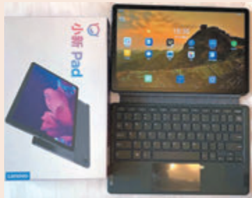
●港區全國人大代表獲送平板電腦，加強工作信息化。受訪者供圖