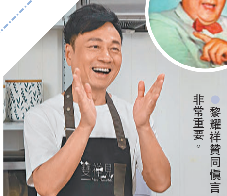
●黎耀祥贊同慎言非常重要。