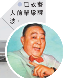
●已故藝人前輩梁醒波。