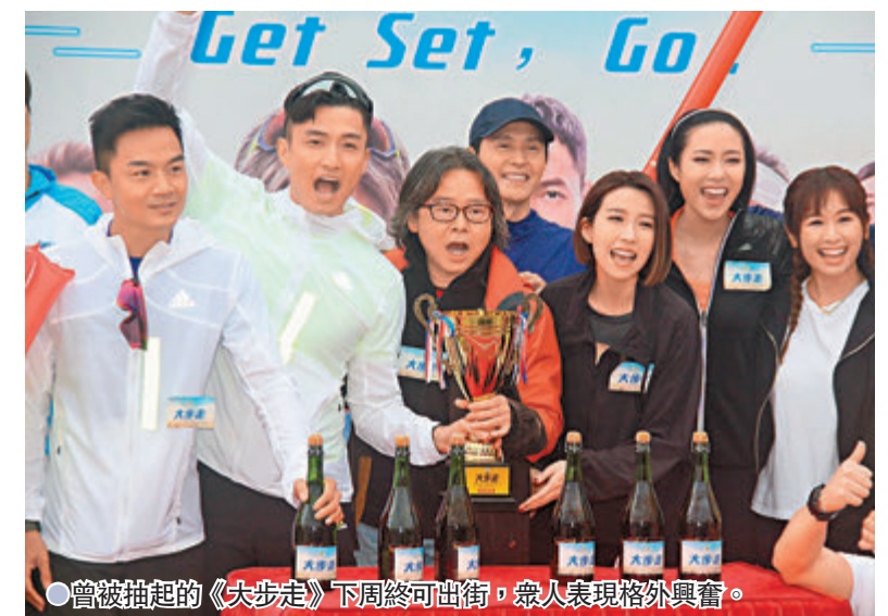
●曾被抽起的《大步走》下周終可出街，眾人表現格外興奮。