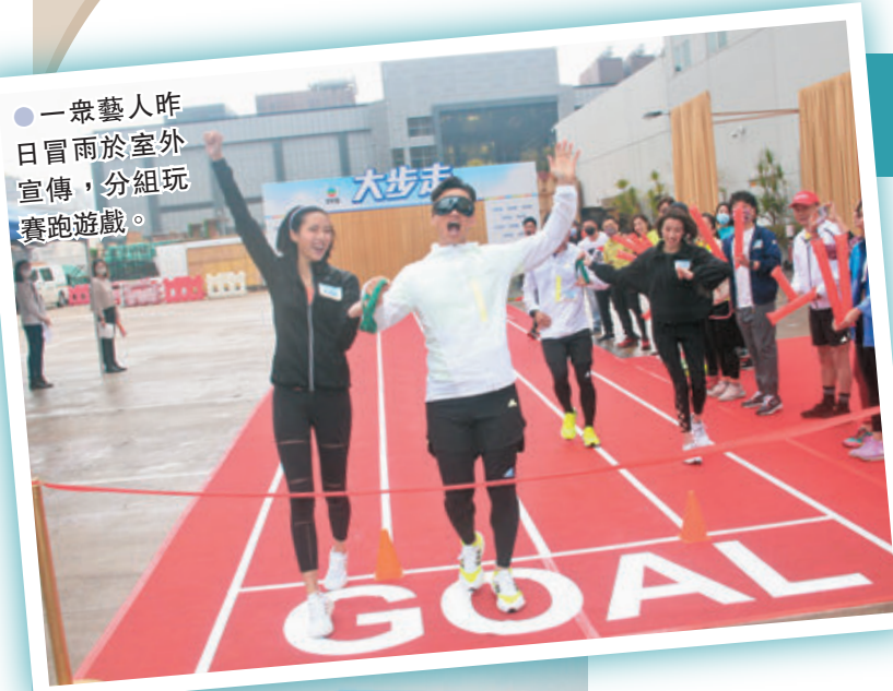
●一眾藝人昨日冒雨於室外宣傳，分組玩賽跑遊戲。