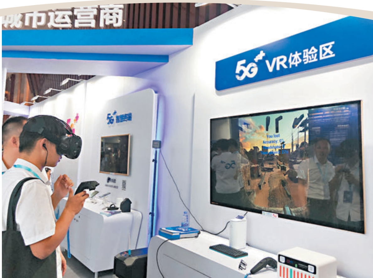
●「十四五」規劃提出支持港澳鞏固提升競爭優勢，多名代表委員提出建言，其中提及應深化兩地的科創合作關係。圖為內地科創賽的5G VR體驗區展示。

全國政協委員謝偉銓表示，隨着粵港澳大灣區的發展，以及國家深化內地與港澳經濟、科創合作關係，深化並擴大內地與港澳金融市場互聯互通，打造高質量建設粵港澳大灣區等等，將為香港帶來發展機遇，香港社會應放下政治爭拗，集中精力，積極發揮所長，深化粵港澳之間的合作，香港一定會更加美好。