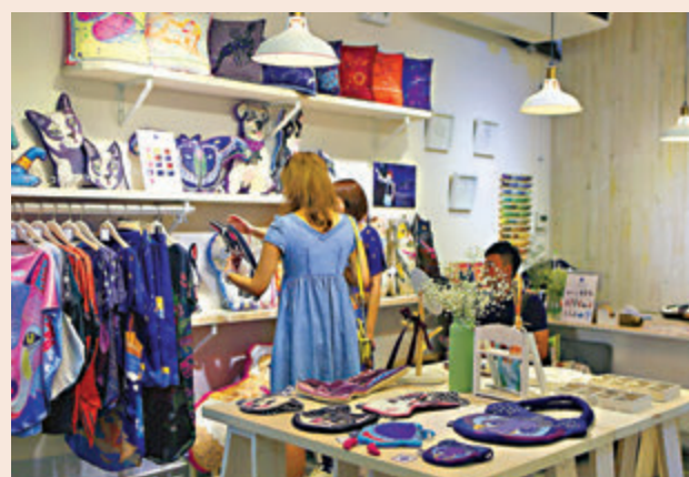
●民建聯建議大力支持文創產業的發展。圖為匯聚本港設計師工作室和店舖的PMQ元創方。

不過，若透過粵港澳大灣區政策，將粵港澳三地的優勢相結合，可以打造國際文創智慧財產權交易中心，從而將我國的文化產業做大做強。所以我們建議，中央可鼓勵及支持粵港澳三地政府透過政策加強推動文創產權交易所的發展，以加強交易的種類和規模，並透過互聯互通等方式，匯集三地的文創IP資源，及完善倉儲、鑒定、物流、託管、結算、孵化和推廣等周邊配套服務，以文創+金融模式打造出大灣區國際文創知識產業交易中心，推動文創產業進一步發展。