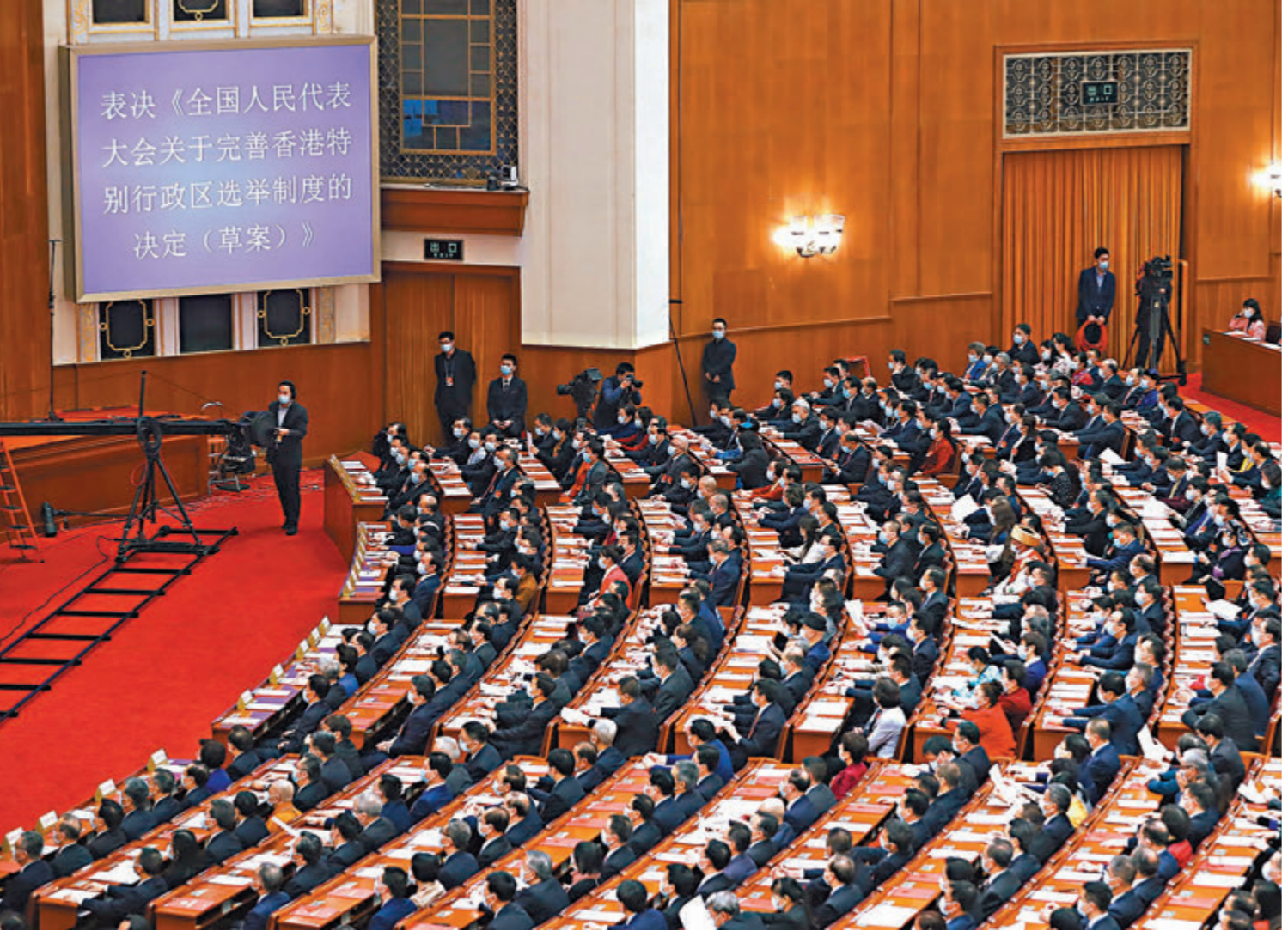
● 十三屆全國人大四次會議表決通過《全國人民代表大會關於完善香港特別行政區選舉制度的決定》。