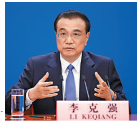
● 國務院總理李克強出席記者會並回答中外記者提問。

香港文匯報訊（記者 馬靜 北京報道）國務院總理李克強昨日下午在北京人民大會堂出席記者會並回答中外記者提問。談及全國人大就完善香港選舉制度作出決定時，他表示，決定很明確，就是要堅持和完善「一國兩制」的制度體系，始終堅持「愛國者治港」，也是為了確保「一國兩制」行穩致遠。 李克強表示，我們明確提出，要繼續全面準確地貫徹