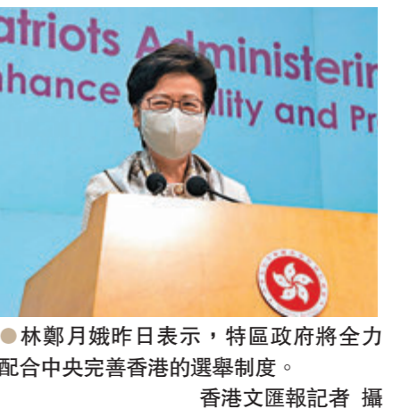
● 林鄭月娥昨日表示，特區政府將全力配合中央完善香港的選舉制度。

香港文匯報訊（記者 鄭治祖）香港特區行政長官林鄭月娥昨日舉行記者會表示，她和特區政府管治團隊對十三屆全國人大四次會議表決通過《全國人民代表大會關於完善香港特別行政區選舉制度的決定》表示堅定支持和由衷感謝，並深信在完善選舉制度以落實「愛國者治港」原則後，可以有效解決近年立法會「泛政治化」和社會內耗不斷的困局，從而用好香港的獨特優勢，在中央的大力支持下拓展經濟，改善民生。待全國人大常委會通過修改基本法附件一和附件二後，特區政府會盡快完成修訂本地法律的工作，及根據香港的實際情況，包括疫情發展，有效安排相關的選舉。 中央出手合憲合法合情 林鄭月娥表示，今次中央主動從國家層面完善香港的選舉制度，充分考慮了香港特區的實際情況。目的是讓香港重回「一國兩制」的初心和正軌，從制度上全面貫徹落實「愛國者治港」原則，讓「一國兩制」行穩致遠，有利於促進香港長期繁榮穩定。 她說，留意到一個個擴大、有廣泛代表性，並能體現社會整體利益的選舉委員會是完善選舉制度的核心要素。特區政府會就選委會五個界別的組成向全國人大常委會提供意見，確保選委會符合相關要求。