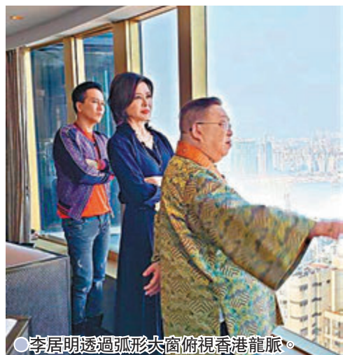
●李居明透過弧形大窗俯視香港龍脈。

香港文匯報訊「大美人」關之琳應邀亮相無綫節目《天天開運王》,更罕有地向外公開其市值約1.5億元的半山豪宅,堪輿學家李居明登堂入室,檢視宅內風水外,更透過弧形大窗俯視香港龍脈。節目中,李居明大師提到關之琳原來是清朝八旗後裔,祖先有熬拜、榮祿及曹雪芹等,能採訪對方感到榮幸,同時關之琳對李大師的風水評論表示十分欣賞,雙方惺惺相惜。李居明大師形容關之琳的半山豪宅是一個風水教室,除公開其香閣風水之外,還俯視香港的龍脈,披露香港風水的得失。此外,關之琳難得公開其名貴高跟鞋收藏。大師亦藉此集教授「呼形喝象」的家居風水旗幟,此法十分實用,節目於今晚播出。據悉,《天天開運王》大受歡迎,已鐵定添食。