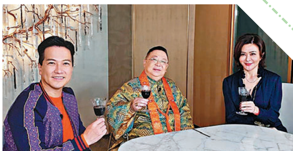
●關之琳亮相無綫節目《天天開運王》,更公開豪宅。