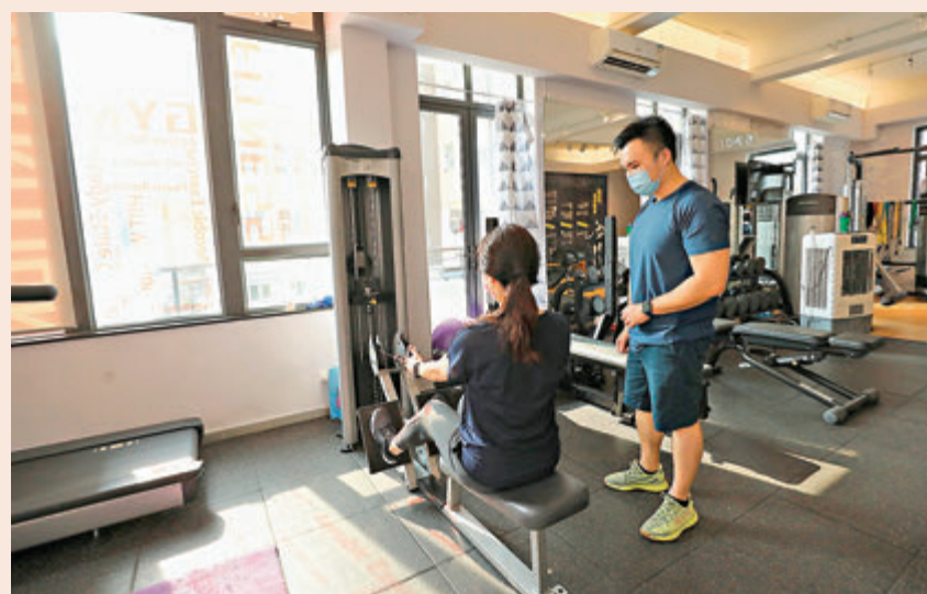
●政府日前宣布身處健身場所人士均需要全程佩戴口罩；健身中心人員亦需要接受強測。

香港文匯報訊（記者 美鈺）特區政府因應URSUS FITNESS健身群組大爆發，收緊對全港健身中心的防疫措施，包括身處健身中心的人士必須佩戴口罩、從業員必須在明天前接受病毒檢測，惟坊間的私人會所同樣設有健身儀器，基於政府對「健身中心」的法律定義含糊，有可能成為漏洞之魚。