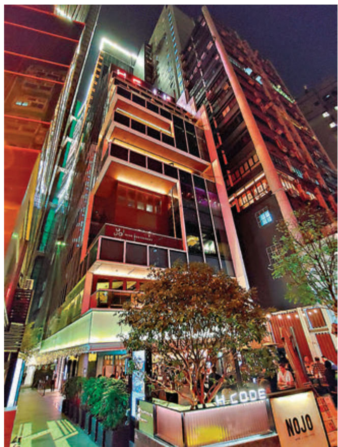
●中環ONE Personal Training已即時暫停營業。

群組的患者至少到過另外12間健身中心，包括utime Fitness Studio、PURE Fitness、Optimum Performance Studio、ONE Personal Training及PURE等，以上健身室已即時暫停營業。政府將發出公告，全港健身中心員工必須於明天前強制接受病毒檢測。