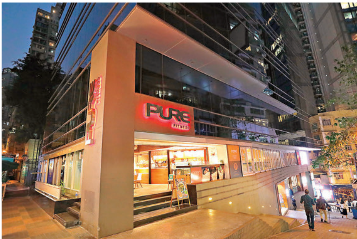
●疫情已由健身中心URSUS FITNESS擴至其他12間健身中心，圖為荷李活道建業榮基中心的Pure Fitness。

昨日全港新增60宗確診個案，當中6宗為輸入個案，而本地個案中，5宗源頭不明，另有約20宗初步確診。在新增的49宗有關連個案中，健身群組佔47宗，包括40名顧客和7名員工或密切接觸者，至今累計64人確診，截至前日有360名密切接觸者須檢疫，也有450人須檢測。