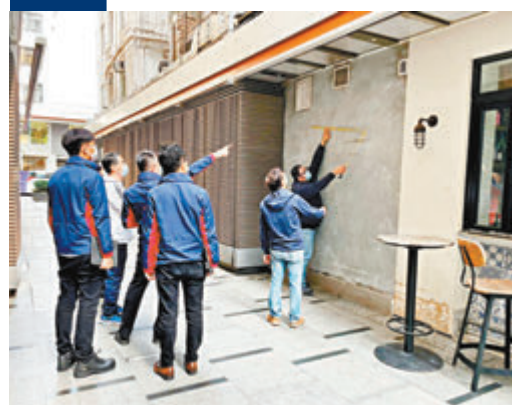
●曾爆發的海饌海鮮牛扒餐廳，停業1天即重開，昨有人檢查通風口。

香港文匯報訊（記者 邵昕）銅鑼灣爆發食肆海饌海鮮牛扒餐廳累計出現4宗確診個案，但有餐廳未理會衛生署停業14天的建議，停業1天即重新營業。香港文匯報記者昨日到現場巡查，餐廳客似雲來。另外，食肆防疫措施放寬逾3星期，市面不少餐廳出現防疫鬆懈，「執枱專員」規定實施幾天後，又故態復萌，職員兼顧落單、執枱、結賬等工作，執枱後未見他們先清潔消毒雙手，再款待其他客人。