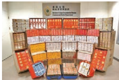
●海關在大埔檢獲約59萬支懷疑私煙，估計市值約160萬元。

香港文匯報訊 香港海關前日（12日）在大埔檢獲約59萬支懷疑私煙，估計市值約160萬元，應課稅值約110萬元。連同本月11日在粉嶺的行動，這是海關連續兩日內再次破獲的懷疑私煙貯存倉庫。