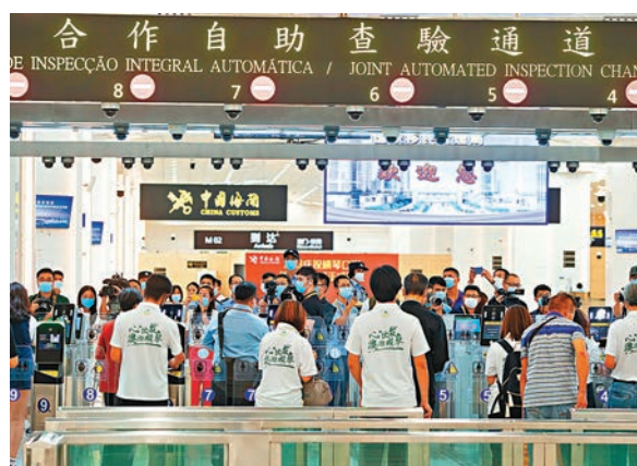
●李家超指，將積極推動皇崗口岸重建工作並在新口岸實施「一地兩檢」。圖為橫琴口岸岸檢區域。

局會繼續與深圳市政府相關單位緊密合作，積極推動皇崗口岸重建工作並在新口岸實施「一地兩檢」，同時配合深圳市落實貨運「東進東出、西進西出」策略，讓跨境貨車在過關後可以更有效率地連接深圳市內的高速公路，連接粵西、粵東以至福建一帶，同時亦紓緩深港兩地的交通。兩地亦會共同研究更高效辦新的查驗模式，加強通關便利。 他續說，特區政府亦會繼續在入境政策和安排上提供便利，吸引大灣區及國際人才投身香港發展，促進粵港澳大灣區人才互動，培養造就大灣區高水準人才隊伍，以鞏固香港作為人才樞紐的地位和配合國家的整體發展策略。保安局會與大灣區內其他10個城市，加強執法部門合作，打擊跨境犯罪，積極推動建設更高水平的平安大灣區。