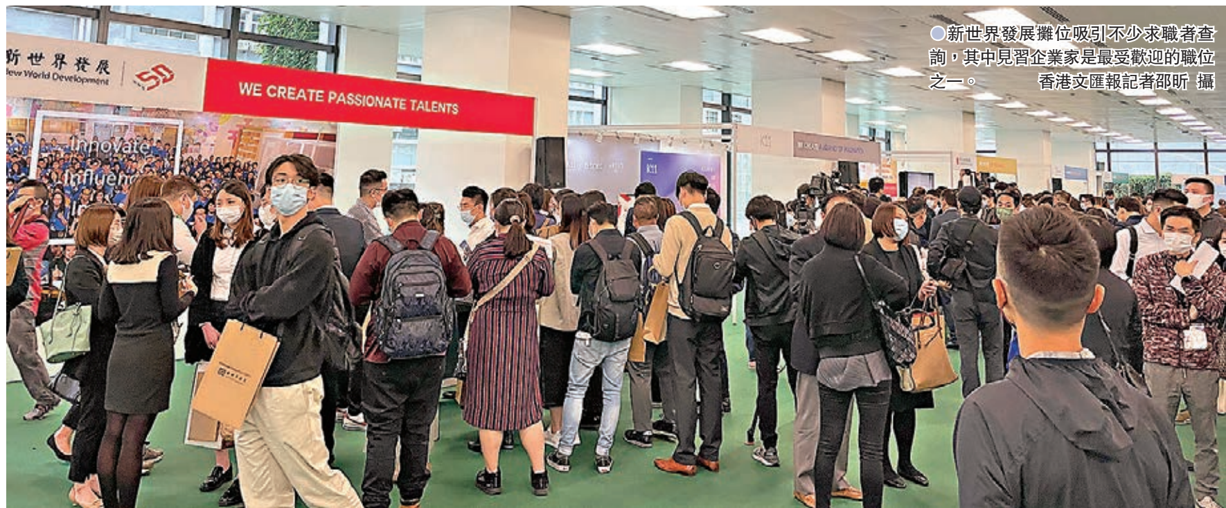
●新世界發展攤位吸引不少求職者查詢，其中見習企業家是最受歡迎的職位之一。

新世界發展昨日舉辦大型招聘會，提供近千個職位，涉及旅遊、數碼營銷、文化等多元領域，過萬名求職者報名參與，當中近三成為待業人士，大家都期望可以把握最快4月就可上班的錄用機會。