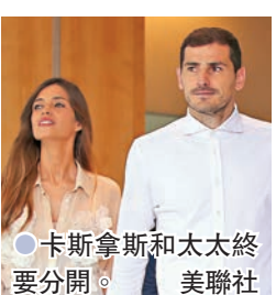
●卡斯拿斯和太太終要分開。

香港文匯報訊(記者 楊浩然)前西班牙國家隊門將卡斯拿斯，昨日和太太莎拉分別於個人社交平台宣布離婚，結束12年的感情。育有兩兒的二人聲明中表示，彼此會一起承擔作為父母的責任；據報卡斯拿斯將會搬走到附近居住，莎拉則和兩名孩子一同生活。