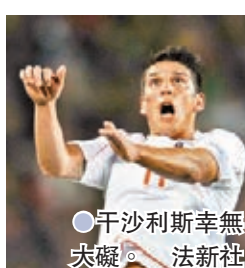
●干沙利斯幸無大礙。法新社

香港文匯報訊(記者 楊浩然)現年36歲，過往曾效力利物浦和貝迪斯等球隊的前智利國腳馬克干沙利斯，日前突然心臟病發，幸好經及時搶救後現時情況已趨穩定。干沙利斯的妻子表示，馬克干沙利斯早前情況一度十分危急，這些日子也是在恐懼中度過。