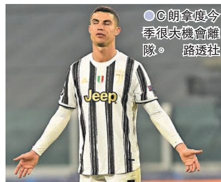
●C朗拿度今季很大機會離隊。

香港文匯報訊(記者 楊浩然)在祖雲達斯於歐洲聯賽冠軍盃出局後，陣中主力基斯坦奴朗拿度(C朗拿度)的離隊傳聞便不停湧現，據最新消息指，C朗拿度已經和前球會皇家馬德里商討了一段時間，而祖雲達斯亦願意以2,900萬歐元低價放走這位葡萄牙巨星。