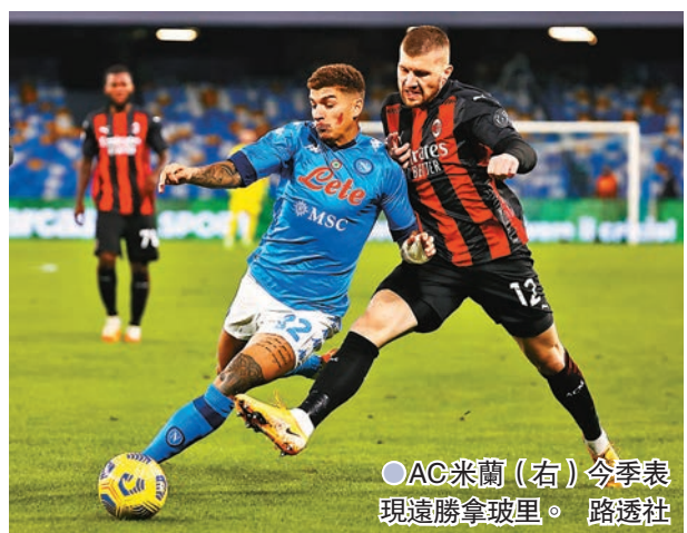
●AC米蘭(右)今季表現遠勝拿玻里。

同日其他比賽，「一哥」國際米蘭只需作客第14位、剛大敗于克羅托內的拖連奴，絕對有力再下一城(有線602、614、654、662台，now638台及無綫myTV Super301台今晚10:00p.m.直播)。至於「三哥」祖雲達斯則希望把歐聯出局的怨氣，發洩在第16位的卡利亞里身上(有線614、654台，now638台及無綫myTV Super301台周一1:00a.m.直播)。