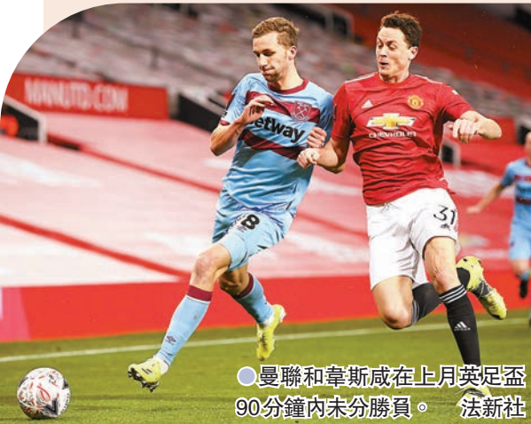
●曼聯和韋斯咸在上月英足盃90分鐘內未分勝負。

韋斯咸在前曼聯領隊莫耶斯帶領下越戰越勇，上輪聯賽又兩球淨勝列斯聯。雖然近況出色的中場連格因借用條款關係不能落場倒戈，但「鎗仔幫」在上月的英足盃曾於相同條件下，在90分鐘內作客悶和曼聯，到加時才被淘汰，但現在曼聯卻進一步受傷兵和體能等問題困擾，衡量後韋斯咸肯定有力搶分。