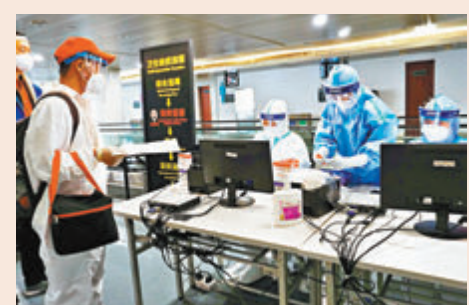
廣東發現三個新冠病毒突變株,相關病例均是在口岸即被納入閉環管理。

廣東省疾控中心表示,將繼續加強對新冠病毒突變株的監測和研究,做好境外輸入病例疫情溯源及病毒變異監測工作,密切跟蹤新冠疫苗對突變株的免疫保護效果評估,進一步落實各項防控措施,確保相關突變株不在省內造成後續傳播。