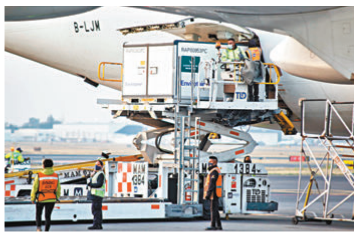
第三批中國科興新冠疫苗日前運抵墨西哥。