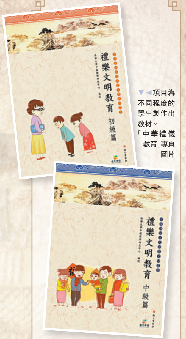
項目為不同程度的學生製作出教材。「中華禮儀教育」專頁圖片