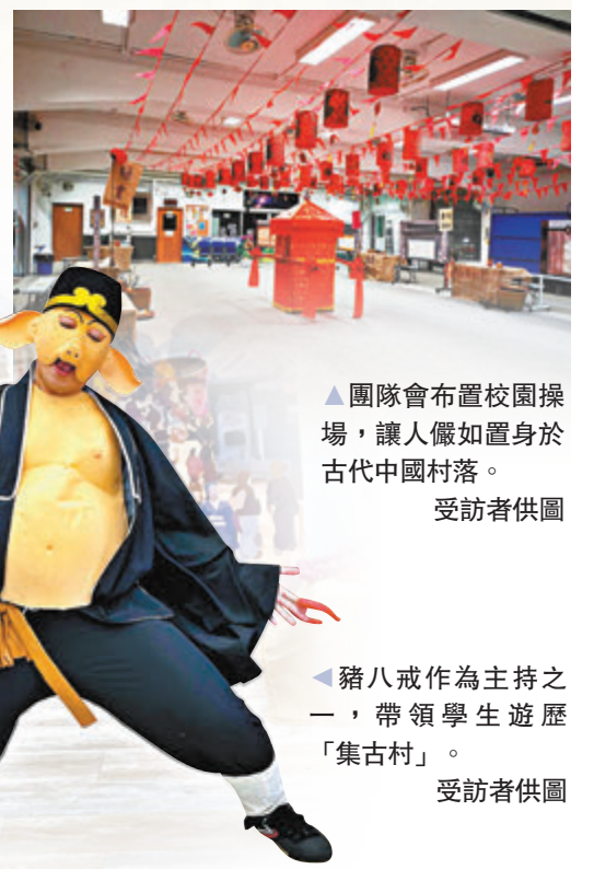
▲團隊會布置校園操場，讓人儼如置身於古代中國村落。受訪者供圖