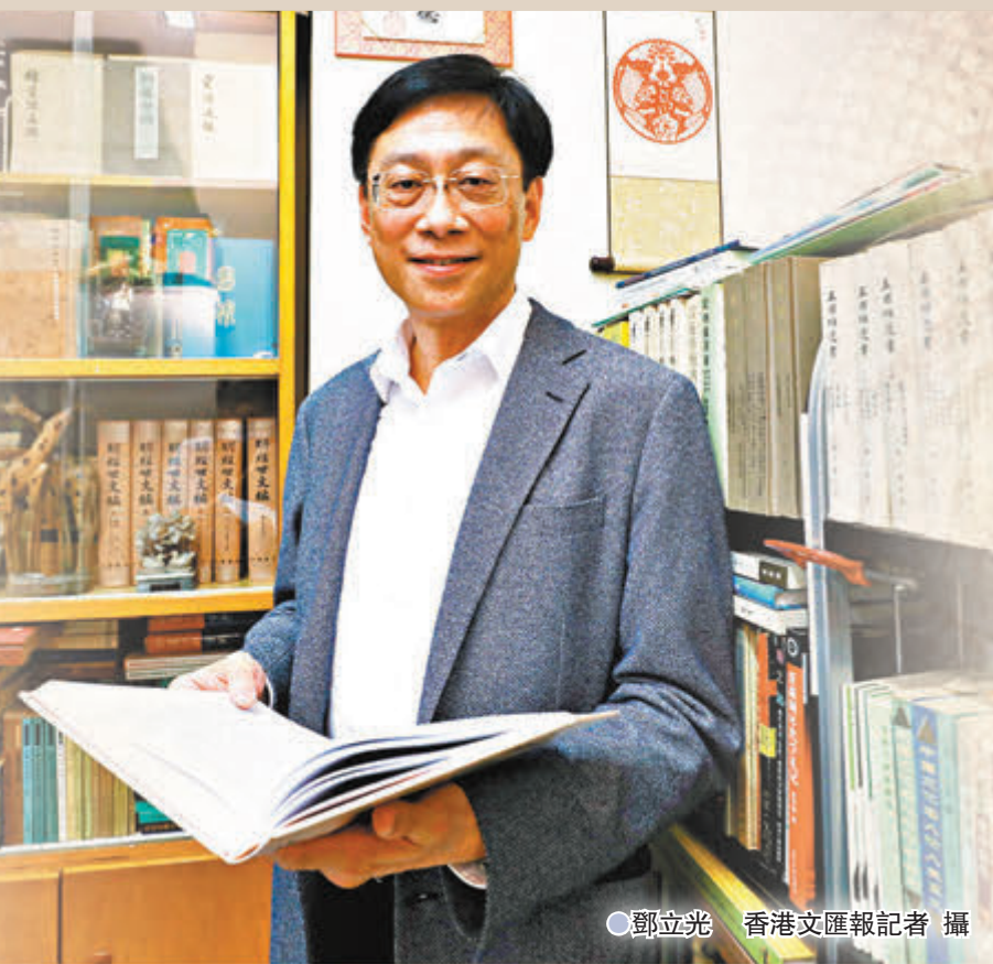
鄧立光 香港文匯報記者 攝

香港文匯報今日起推出「文史教育把脈」系列報道，讓專家學者和推動文史教育的有心人，為香港的中華文化與歷史教育把脈，並透過各式傳承與弘揚中華文化的項目出謀劃策，致力於社會特別是青年學生之中促進文化認同。