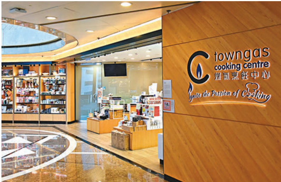
●煤氣公司業績公告指，疫情下新居入伙減少，市民消費意慾疲弱，爐具銷售量亦較上年度下降12.7%，銷售額下降8.3%。