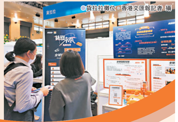
貨拉拉攤位。

獲廣東省政府及香港特區政府資助的「大灣區青年就業計劃」，昨日起一連兩日於旺角麥花臣場館和網上同時舉行招聘博覽，提供逾800個職位。其中，實體招聘會全日吸引328名港青到場，爭取高達3萬港元的「筍工」。不少求職者表示，對灣區就業前景充滿信心，更有求職者雖然已獲香港金融機構聘用，但為使事業再上一層樓，願放棄香港職位到灣區闖關；也有應徵者表示，香港經濟連連受暴力衝擊及新冠疫情拖累，短中期內的發展前景較灣區遜色，故希望北上創一番事業。