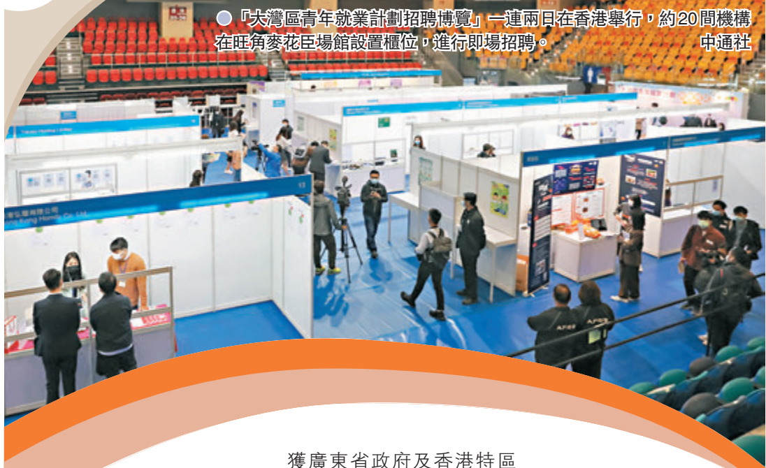
「大灣區青年就業計劃招聘博覽」一連兩日在香港舉行，約20間機構在旺角麥花臣場館設置攤位，進行即場招聘。