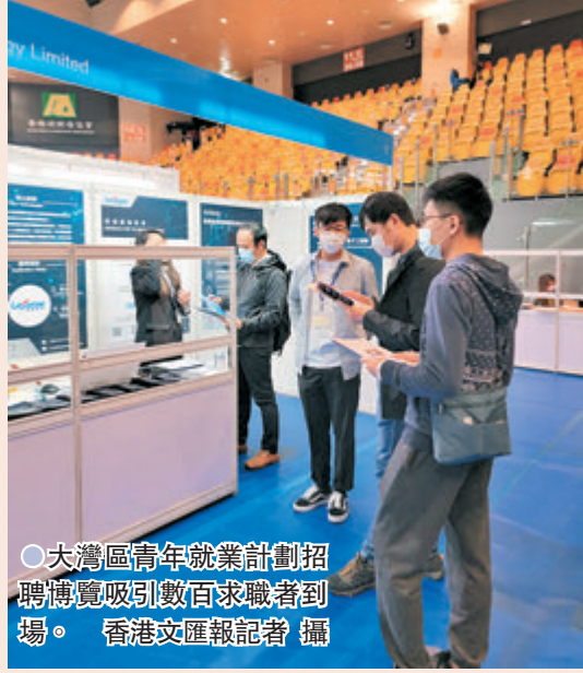
大灣區青年就業計劃招聘博覽吸引數百求職者到場。