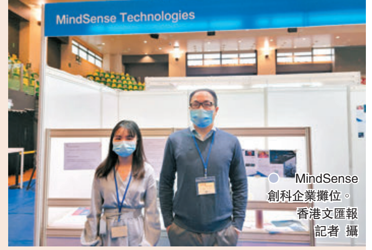
MindSense 創科企業攤位。