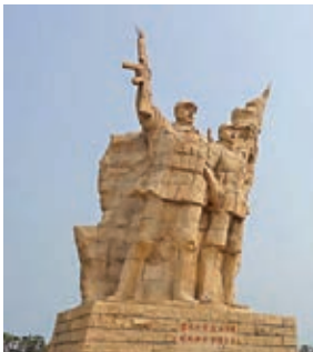
●解放海南島渡海登陸點