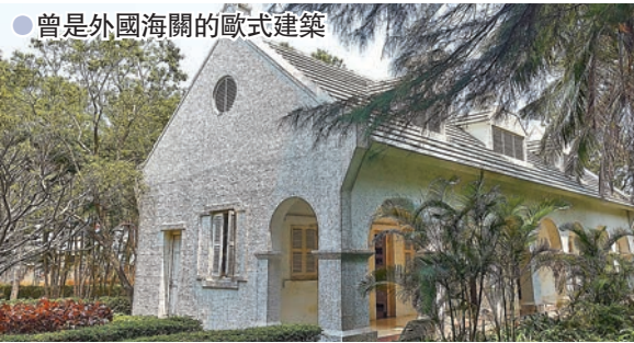
●曾是外國海關的歐式建築