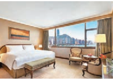
●馬哥孛羅香港酒店