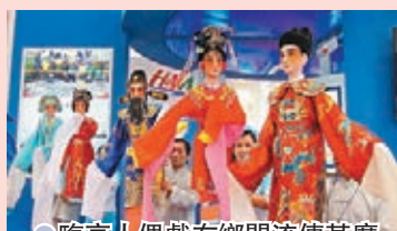
●臨高人偶戲在鄉間流傳甚廣

如果是逢年過節到臨高，就有機會欣賞到已傳承800餘年的人偶戲，這個源於南宋末期的地方戲曲已被列入國家級非物質文化遺產名錄。臨高人偶戲是從民間佛像祭祀的宗教活動演變而來，其表演特點為幕台不設布幃，演員手擊木偶化裝登台，人與偶在台上共同扮演角色，人偶互為一體，以瓊劇唱腔表演為基