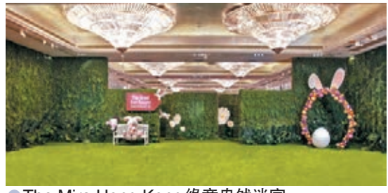
●The Mira Hong Kong綠意盎然迷宮