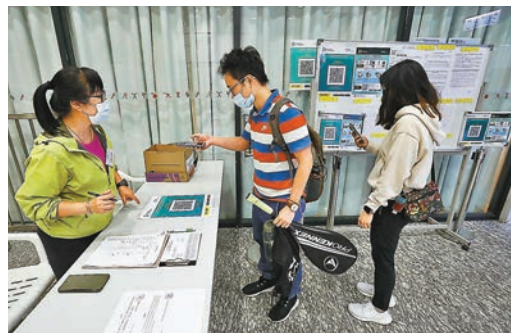
●若市民選擇寫紙仔登記資料，場地人員或會根據紙仔上的電話號碼即時致電，核實後才准進入。

發言人說，有關場所資料會以公開數據形式發放，「安心出行」程式會定時自動下載該等場所資料並在用戶自己的手機內作比對，如確診者的