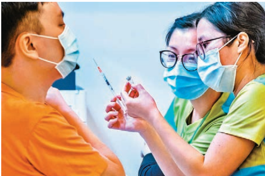
●崔俊明表示，復必泰疫苗在短時間內出現多宗包裝有問題個案的情況罕見，瑕疵比例偏高，並批評藥廠品質控制有問題。