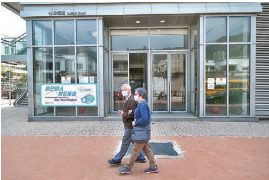
●教育局九龍塘教育服務中心的復必泰疫苗接種中心，昨天仍然關閉暫停接種疫苗。