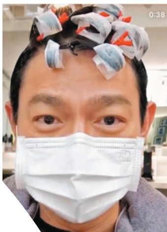
●為了角色需要，華仔特別去電髮。