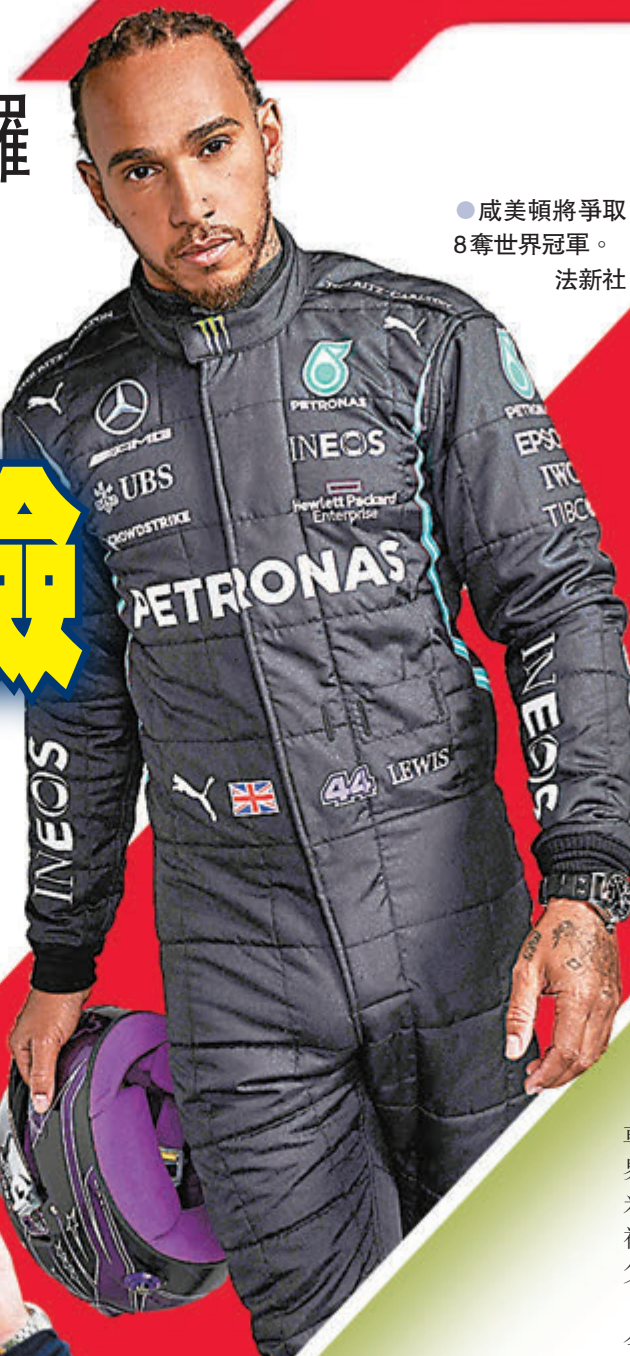
●威美頓將爭取8奪世界冠軍。