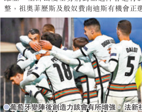
在狼狽狀態低沉；今場面對實力不俗的塞爾維亞，主帥山度士將對正選陣容進行調整，祖奧菲歷斯及般奴費南迪斯有機會正選上陣。

香港文匯報訊(記者 郭正謙)星光熠熠的葡萄牙在今夏歐國盃以冠軍為目標，不過球隊日前在世界盃外圍賽首戰表現卻令人失望，今場面對實力更強的塞爾維亞勢將遇上更大考驗。主帥山度士今仗或將變陣出擊，祖奧菲歷斯及般奴費南迪斯極可能復任正選，與C朗拿度攜手攻堅。(有線601、661台周日3:45a.m.直播) 葡萄牙上場只能憑藉一記「烏龍球」小勝阿塞拜疆，以C朗拿度為首的鋒線令人失望。事實上鋒線的啞火源於中場供應不足，摩天奴及魯賓尼維斯一對中場組合今季