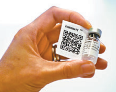
●出現瑕疵批次疫苗會在藥廠完成最終調查報告前繼續封存。資料圖片

香港文匯報訊（記者 文森）BioNTech及輝瑞藥廠最新公布的臨床研究顯示，12歲至15歲人士接種復必泰疫苗的有效預防率達100%，計劃向美國食品藥品管理局（FDA）和歐洲藥品管理局（EMA）申請批准，將接種年齡下限由現時16歲降至12歲。香港特區衛生署署長陳漢儀昨日表示，若BioNTech向香港申請疫苗用於青少年組別，會按程序索取臨床數據以作出審批。