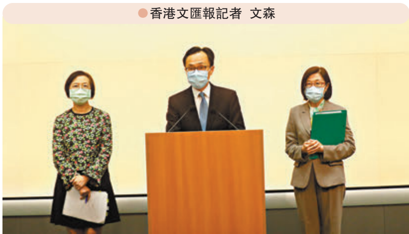
●香港文匯報記者 文森

德國藥廠BioNTech昨日向香港特區政府提交中期調查報告，表示早前出現包裝瑕疵的復必泰疫苗批次並無品質安全問題。特區政府昨日指，在藥廠正式完成最終調查報告前，會繼續封存相關批次。新一批約30萬劑、於另一廠房封裝的復必泰疫苗今日會抵港，下周一可恢復為市民接種復必泰疫苗。特區政府已為受暫停接種影響的第二劑接種人士預留一個接種時間，有關市民可按政府預留時段接種疫苗，或自行到網上系統改期。