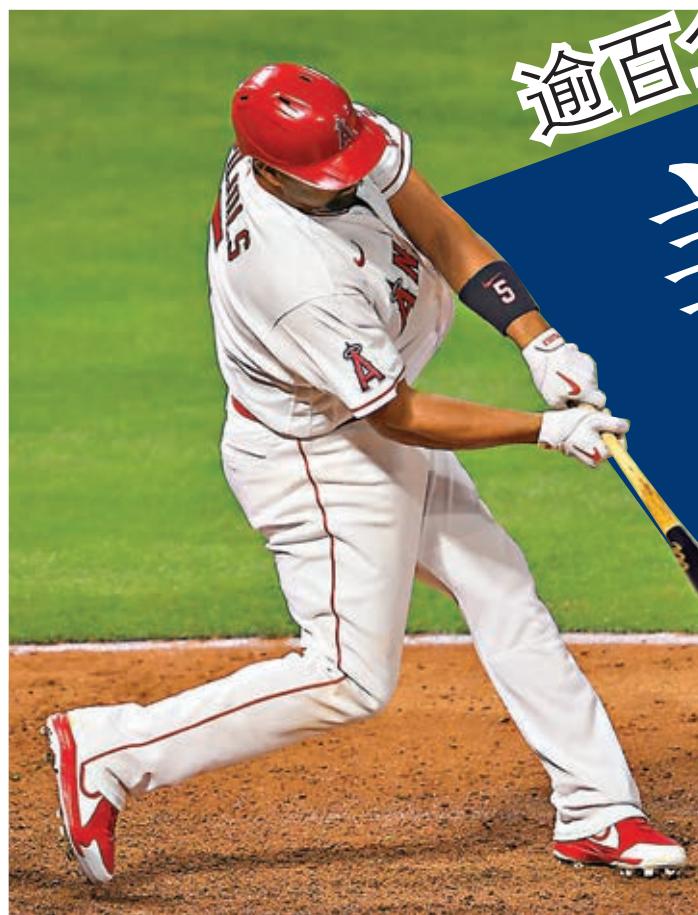
●MLB將今年的明星賽從佐治亞州移師至其他州份舉行。