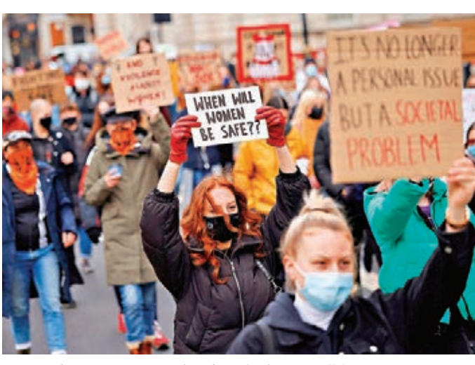
●英民眾示威遊行，抗議國會正審議的擴大警權法案。

利茲和布賴頓等城市發起示威，在倫敦海德公園聚集的示威者不斷高呼口號，並高舉「Kill the Bill」的標語。 儘管英國近日開始放寬防疫限制，相關組織可向當局提交風險評估，並在確保社交距離下舉辦示威活動。但倫敦警方表示，基於公眾健康考慮，在必要情況下會嚴正執法，驅散示威者。 另一方面，繼北愛爾蘭倫敦德里市連續4晚發生騷亂後，首府貝爾法斯特前晚亦發生騷亂，大批青年向警方投擲玻璃樽和磚塊，至少8名警員受傷，警方拘捕7人。 ●綜合報道