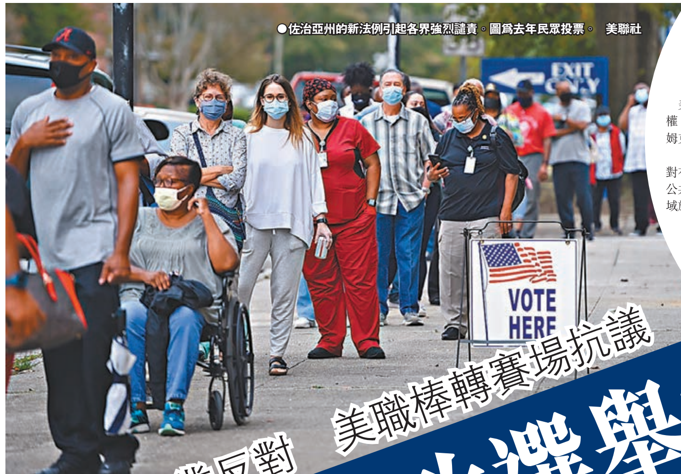
●佐治亞州的新法例引起各界強烈譴責。圖為去年民眾投票。

美國前總統特朗普在大選落敗後，多個由共和黨主政的州份，紛紛推動修改選舉法例，被批評試圖限制選舉權，尤其阻撓有色人種等弱勢群體投票。其中，佐治亞州上月更已實施相關法例，引起各界強烈譴責，商界亦紛紛發聲，逾100間企業的高層前日發表聯合聲明，表明反對任何阻止合資格選民投票的措施，總統拜登更表示支持美國職棒大聯盟(MLB)，將今年的明星賽從佐治亞州移師至其他州份舉行。