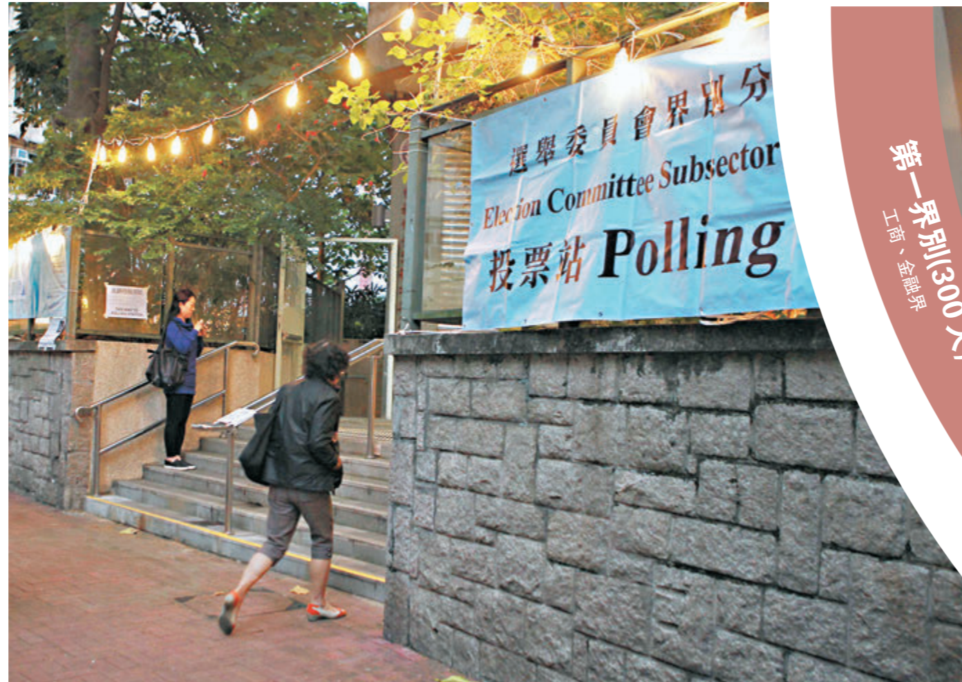
●社會各界人士認為，新選制充分體現制度的更廣泛、均衡的參與性。圖為2016年選委會選舉的票站。