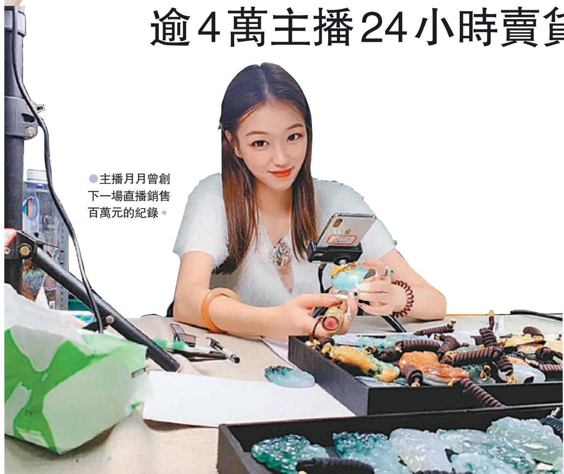
●主播月月曾創下一場直播銷售百萬元的紀錄。