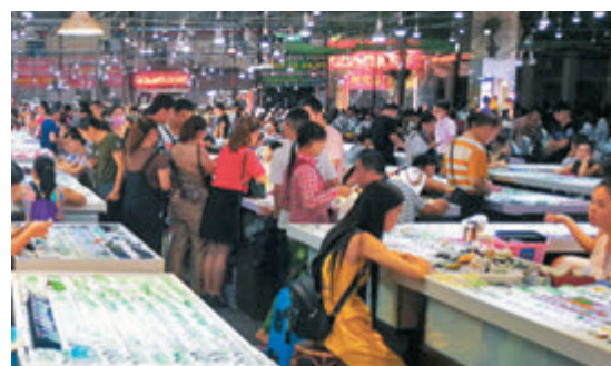
●傳統線下店舖擁有體驗感強、客戶黏度高的銷售優勢。

相對直播，體驗感強、客戶粘度高則是線下銷售模式的優勢。傳統線下店舖更注重培養自己的忠實客戶，通常有自己的固定客戶群，可以經營數十年甚至上百年，並形成響譽的品牌，更有利於吸引更多「回頭客」。