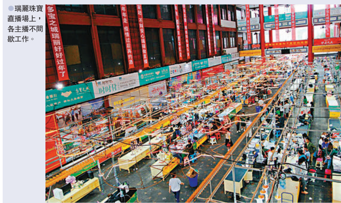
●瑞麗珠寶直播場上，各主播不間歇工作。