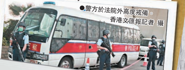
●警方於法院外高度戒備。