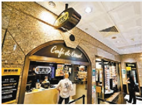
●景富樓確診者曾到訪中環萬邦行大家樂。