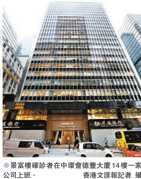
●景富樓確診者在會德豐大廈14樓一家公司上班。