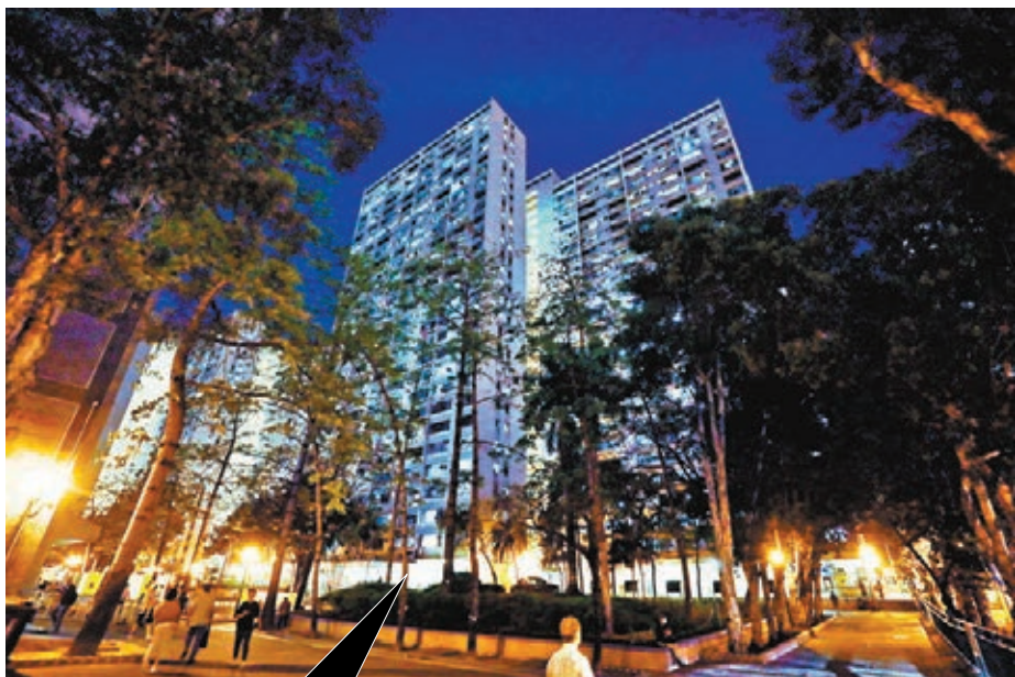
●屯門友愛邨愛暉樓第三座兩名七旬婦一確診一初確。

對於前日一名12天大初生男嬰確診，張竹君指男嬰數名家庭成員也染疫，最先發現確診的是父親，其後母親及胞姐也診斷，但未知男嬰是否屬母嬰傳播，「如果母親早期已感染，其他家人應早出現病徵，但另一名小朋友(胞姐)4月5日後才不適，故有可能是家居傳播。」 男嬰目前情況穩定，毋須藥物治療。