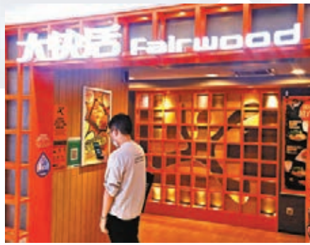
●景富樓確診者上班期間曾到中環萬年大廈大快活食飯。