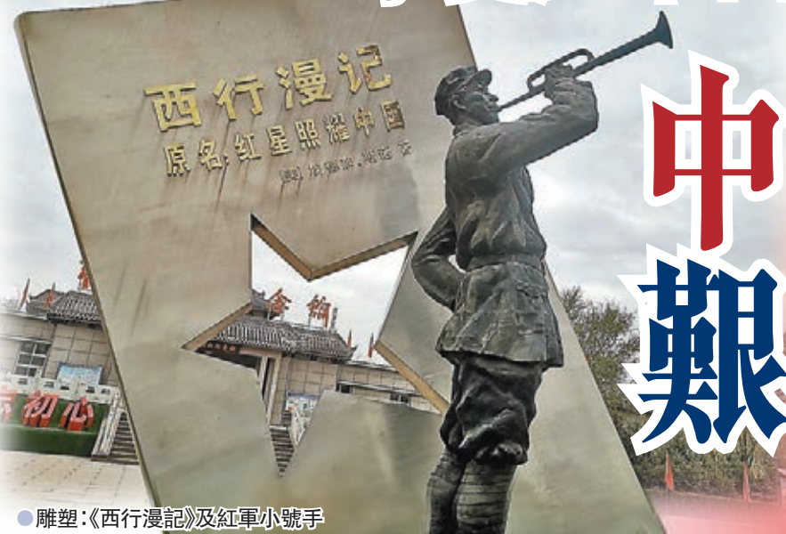
●雕塑：《西行漫記》及紅軍小號手

坐落在寧夏中部同心縣（豫旺堡）南郊的紅軍西征紀念園，建成於2006年10月紀念紅軍長征勝利暨陝甘寧省豫海縣回民自治政府成立七十周年之際，是內地唯一一家以紅軍西征為主題的紀念場所，是全國百家紅色經典景區之一。園內主體建築有紅軍西征紀念館、有世界名著《西行漫記》和世界經典圖片紅軍小號手的大型雕塑，亦有正反兩面鑄刻着肖克將軍題寫的「紅軍長征陝甘寧、三軍會聚同心城」，以及國際主義戰士馬海德題寫的「同心同德、同建同心」高7米多、重達84噸的奇石，更有以70級石階連為一體的、有着600多年歷史和光榮革命傳統的同心清真大寺等。走進高19.36米旗杆式的大門，寓意1936年，「中國工農紅軍西征紀念園」11個大字昭示着國家級文化價值的地位及紅軍揮戈西征的那段波瀾壯闊的歷史。