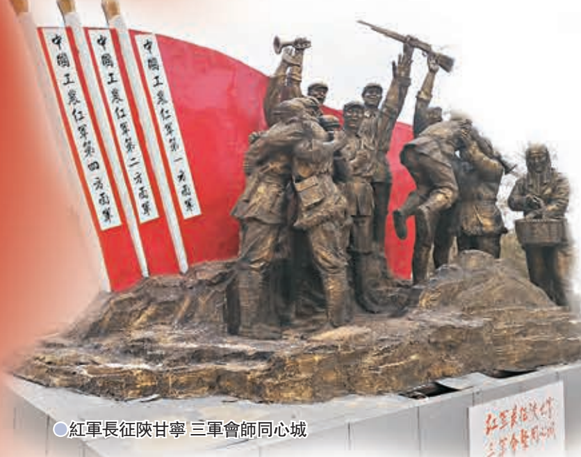
●紅軍長征陝甘寧 三軍會師同心城