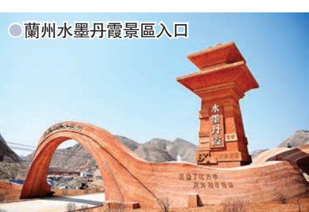
●蘭州水墨丹霞景區入口