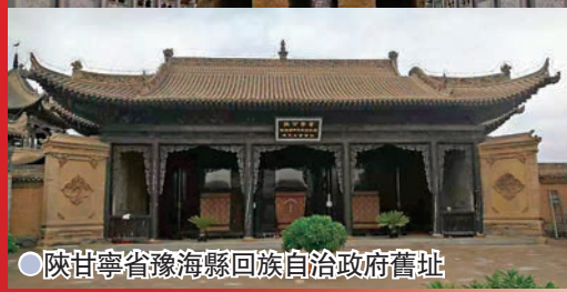
●陝甘寧省豫海縣回民自治政府舊址