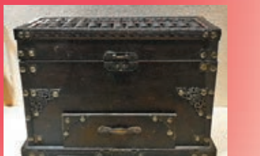
●斯諾用過的算盤箱