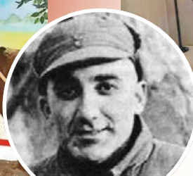
●喬治·海德姆

做了如實的報道，受到國民黨反動派的打擊，被迫離開中國。解放後，斯諾先後於1960年6月、1964年、1970年10月等多次來到中國，見到毛澤東主席、周恩來總理，進行了親切的談話，並對中國人民的偉大事業做了友好的介紹和報道。我們的子子孫孫永遠不要忘記，在中國革命最艱難的歲月裏，曾有一位美國記者騎着黑色的戰馬，馳騁在中國大地上，首次向世界作了真實、動人的關於中國紅軍和紅色根據地的報告。