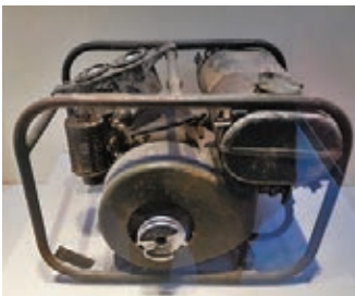
●紅軍用過的小型發電機