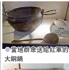
●當地群眾送給紅軍的大銅鍋