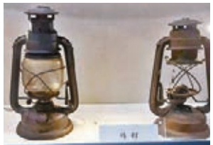
●斯諾及馬海德用過的馬燈