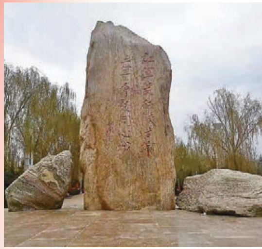
●肖克將軍題寫的「紅軍長征陝甘寧 三軍會師同心城」