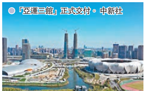
●「亞運三館」正式交付。

日前從杭州亞運組委獲悉,由中建八局投資建造運營的杭州「亞運三館」正式建成交付,標誌著「亞運三館」由建設期正式轉入賽事服務期,各項賽事保障工作全面開啟。