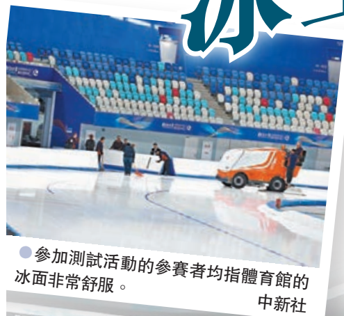
●參加測試活動的參賽者均指體育館的冰面非常舒服。中新社