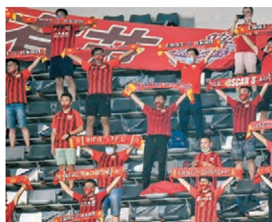
●球迷將可入場觀看中超開幕式。

另一方面,深圳市足球俱樂部昨日召開誓師大會,主帥祖迪魯夫表示:「我來到中國3年了,從外部和內部都看到了深足的成長。球隊的發展離不開深圳市政府、佳兆業集團、贊助商的大力支持,也離不開球迷的一路相伴。我期待球迷再次走進球場,讓隊員們聽到大家的吶喊助威。新一季我們會竭盡全力,用行動回報大家的信任,令大家引以為傲。」