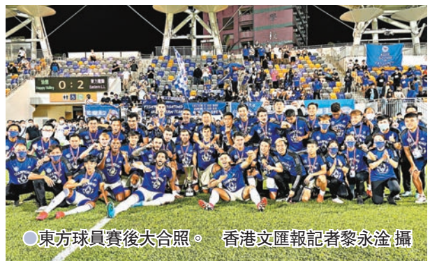
●東方龍獅賽後合照。

香港文匯報訊(記者郭正謙)東方龍獅首奪菁英盃冠軍!憑藉艾華度和林恩許各建一功,東方昨晚於旺角大球場以2:0擊敗愉園,奪得今季首項錦標外,亦是球隊史上首個菁英盃冠軍。