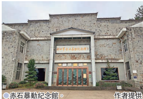
●赤石暴動紀念館。

在悼念廣場之北，一座曲折長廊左側碑牆上，刻着《新四軍老同志詩集》，十餘位老兵緬懷戰友的詩篇赫然在目。其中，有曾任新四軍《抗敵