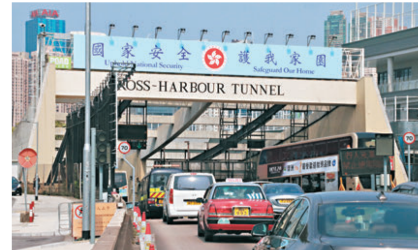
●本周四為香港國安法落實後首個「全民國家安全教育日」，特區政府在紅磡出入口展示「國家安全，護我家園」的橫幅。資料圖片

他指出，維護國家安全是任何地方發展經濟的必要條件，而本月15日(本週四)是香港國安法落實後首個「全民國家安全教育日」，特區政府在紅磡出入口展示「國家安全，護我家園」的橫幅，是特區國家安全委員會宣傳和教育工作的一部分。張建宗續指，稍後將有一系列活