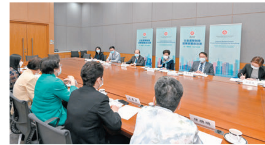
●張建宗及各局局長近日分別主持多場解說會，向各界人士講解完善香港特區選舉制度安排，特首林鄭月娥亦有出席。網誌圖片

另外，張建宗表示，現時香港已開始重回正軌，暴力事件大致消失，「港獨」思潮漸消退，社會運作亦已恢復。